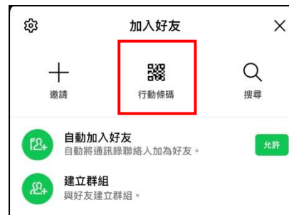
點選加入好友 開啟行動條碼