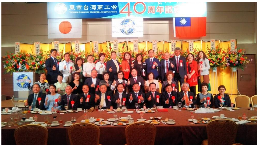
東京台灣商工會 40 周年慶祝大會上大合照