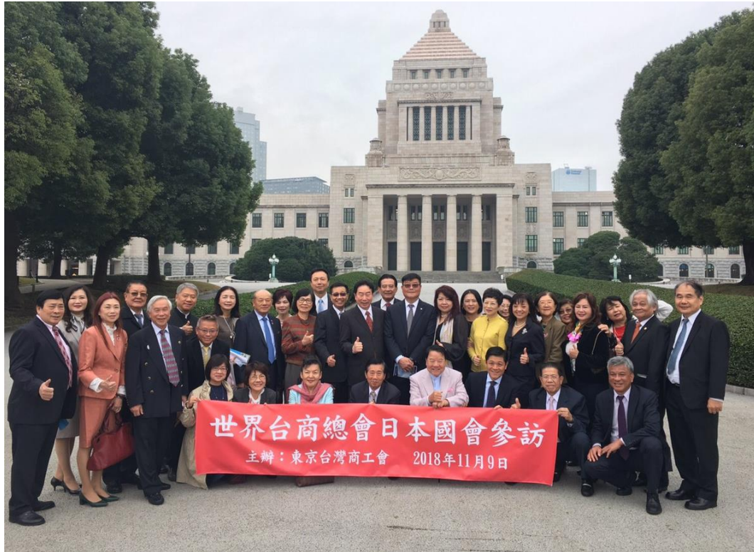
世界台商總會日本國會參訪團全體合照