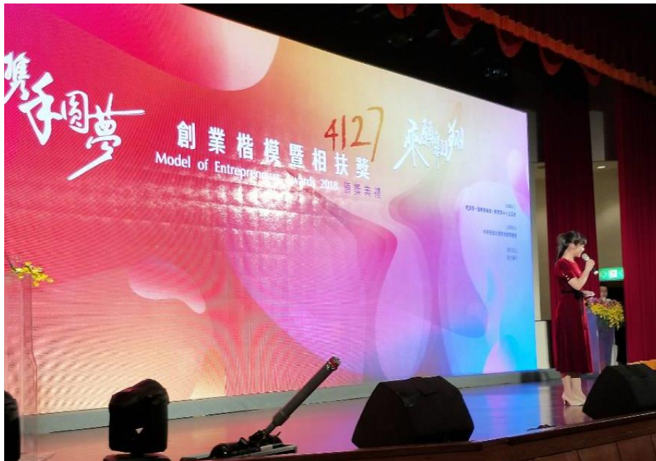
中華民國第 41 屆、海外華人第 27 屆創業楷模暨相扶獎頒獎典禮