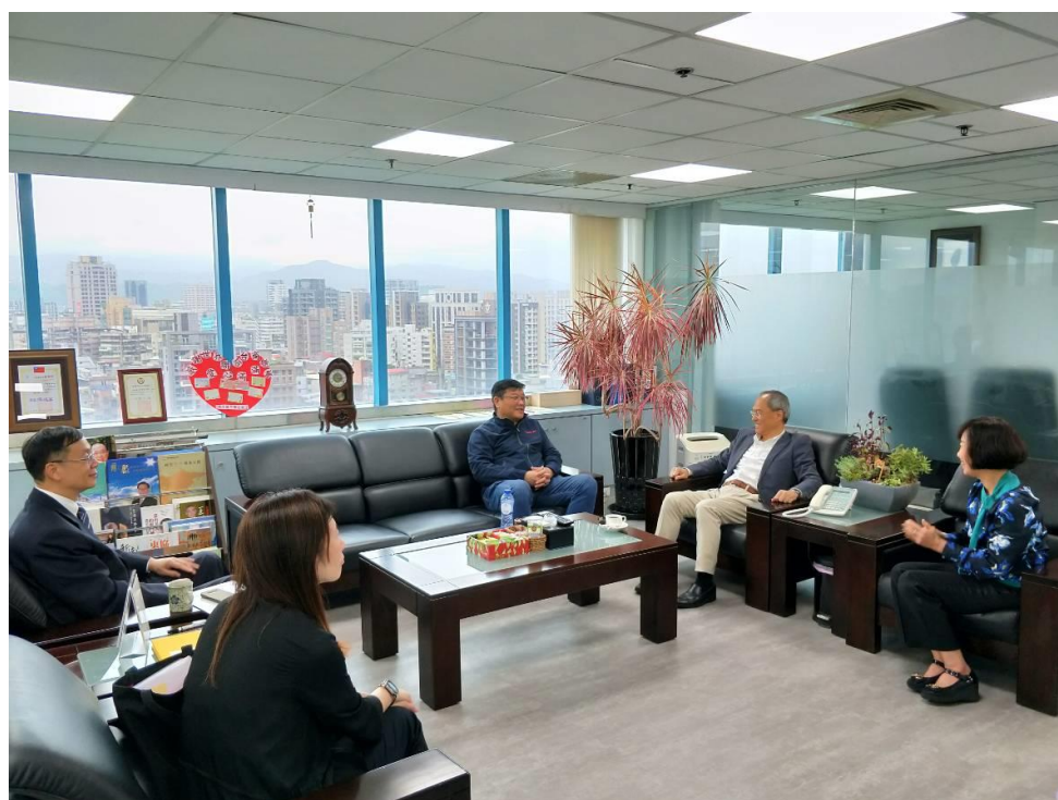
吳委員長新興與總會長相談甚歡