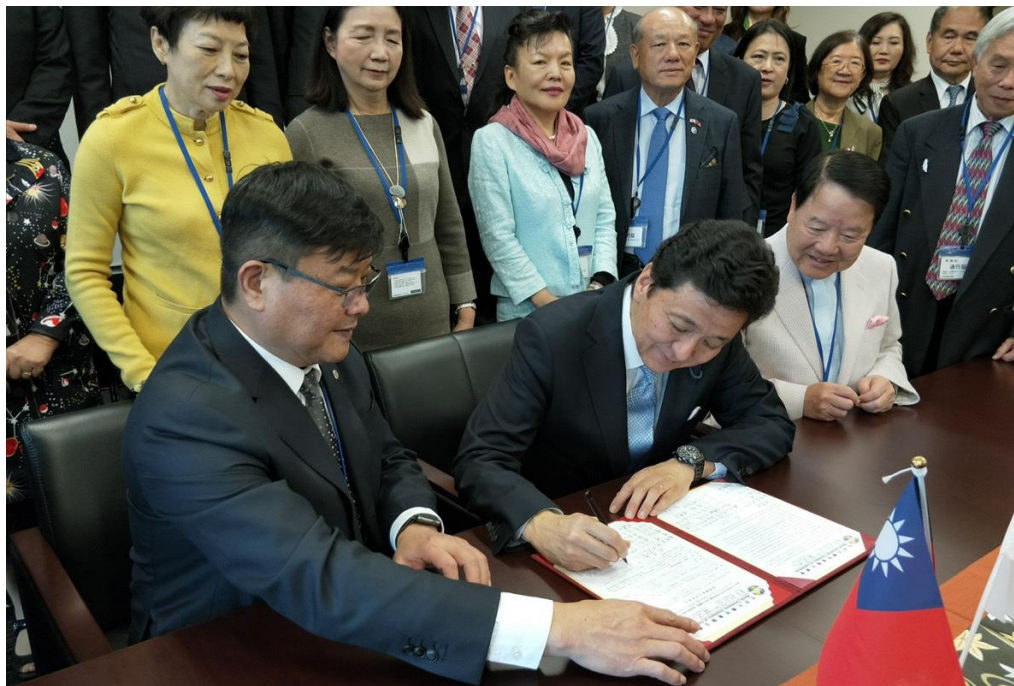
游總會長與岸信夫互相交換說帖

東京台灣商工會在十一月十日於池袋舉行四十周年慶祝大會，會中陳慶仰會長並頒贈四十周年慶相關人員獎牌，慶祝晚會有日本各地台商、僑領及來自世界各地台商等，還有日本國會議員，數百人齊聚，場面隆重。