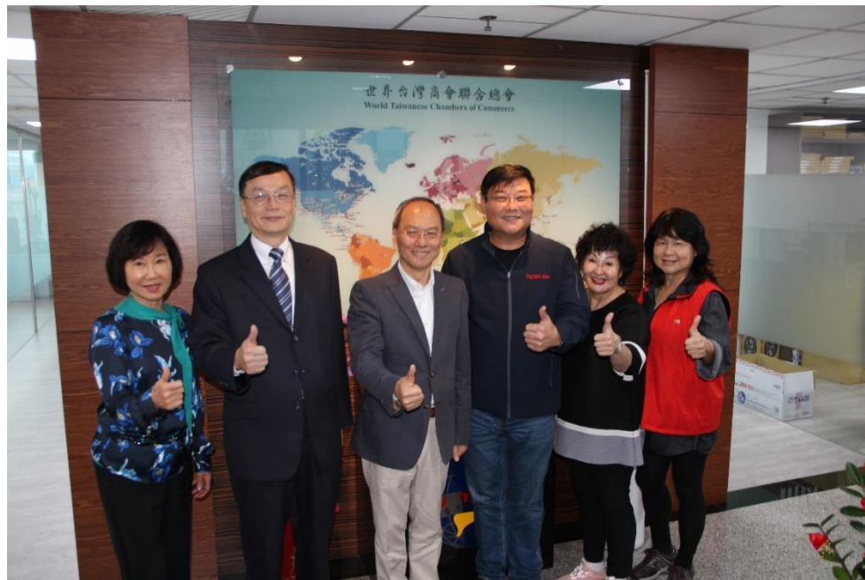
吳委員長新興及僑民處郭處長大文於總會辦公室與總會長合影

僑委會吳委員長新興於 11 月 27 日下午由僑民處郭處長大文及李科長嘉宜陪同蒞臨本總會，拜會游總會長了解台商會務活動及僑委會如何配合服務台商。