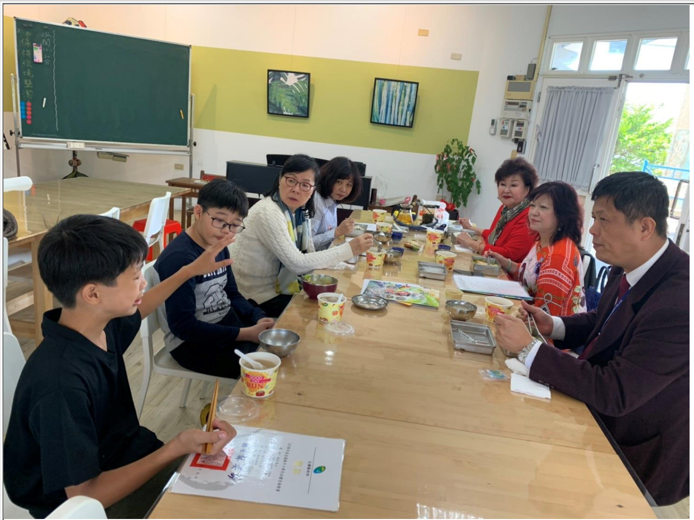
◎與受助學孩童一同用餐