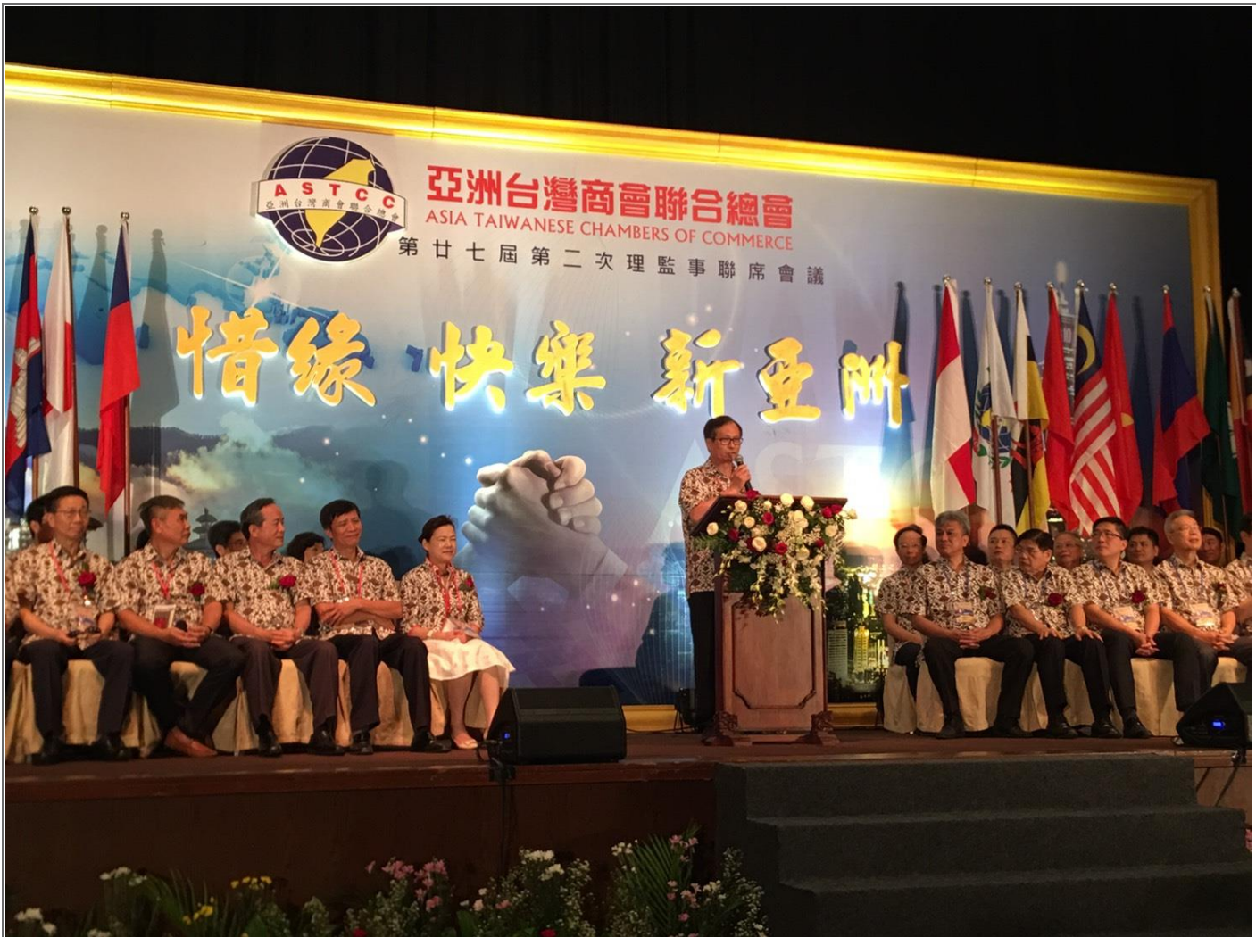
◎施總會長於開幕典禮致詞

本次會議除了召開理監事等各場次會議討論會務發展外，也安排專題演講「亞洲臺商經貿投資論壇」，特別邀請經濟部政務王次長美花、印尼政府代表等專業人士及機構代表主講包括「中美貿易摩擦對我新南向政策的挑戰與商機」、「印尼政府對我新南向政策的觀察與因應」等重要主題，以及多場有關臺商投資布局之座談與交流活動，相關主題切合臺商投資實務需求，與會僑臺商反應熱烈。