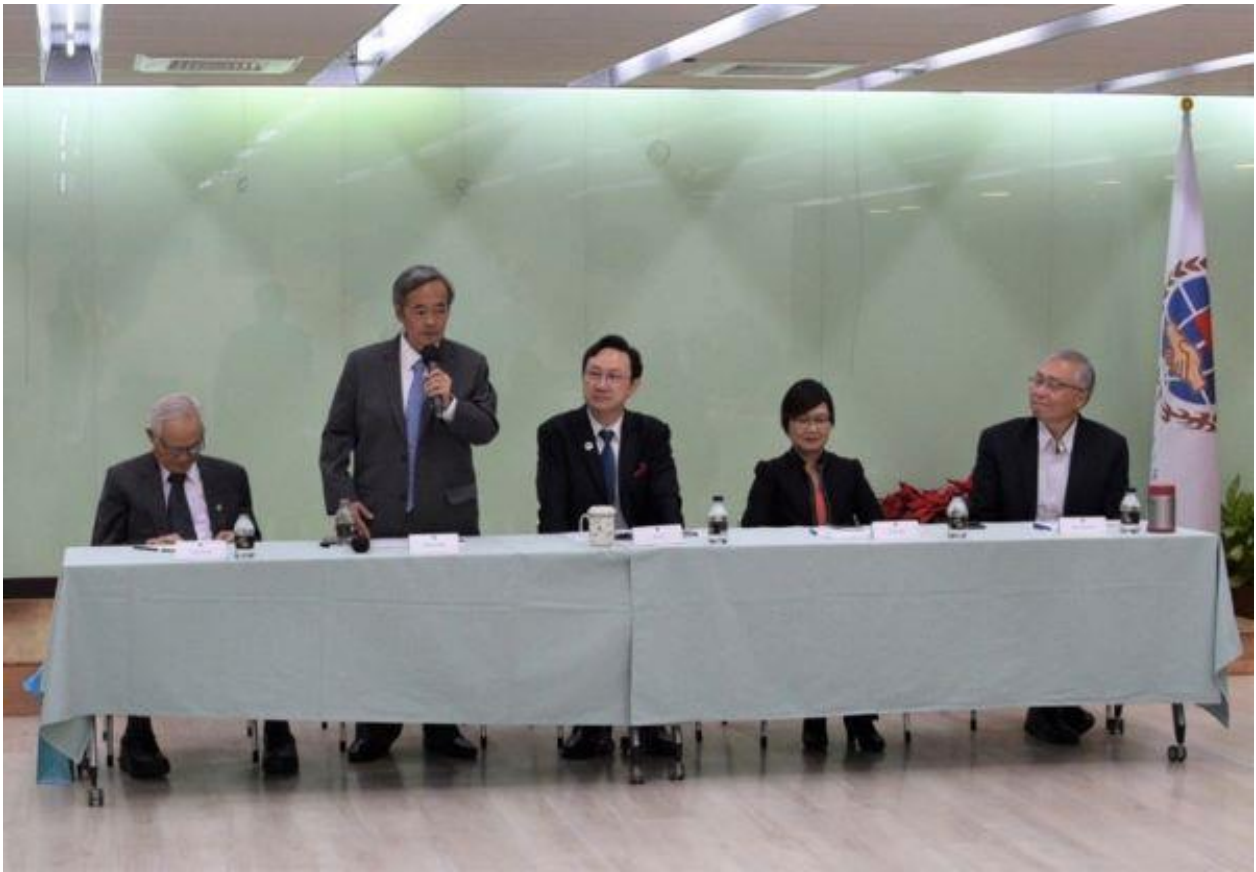
◎梁總會長輝騰提出對海外僑臺胞健保問題的建言