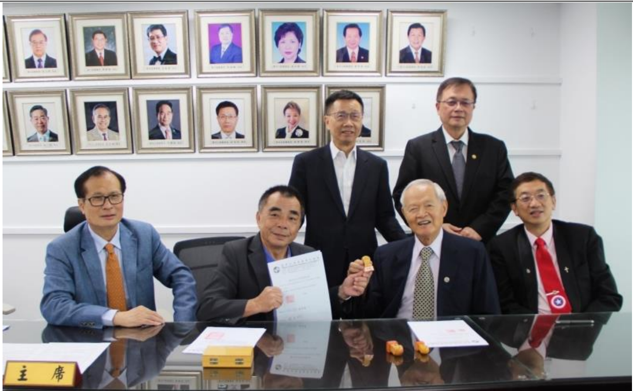
◎新卸任監事長辦理印鑑移交。