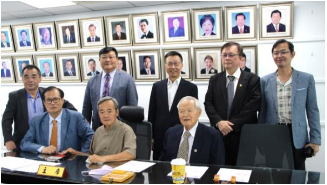
◎順利辦理行政會務移交