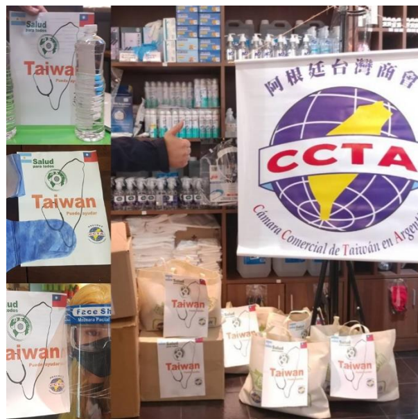
◎阿根廷台灣商會捐贈防疫物資予貧民區健康中心服務的第一線醫護人員