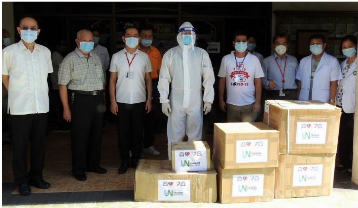
◎旅菲南線台商會贈防疫物資予甲美地省卡摩那市(Carmona)政府