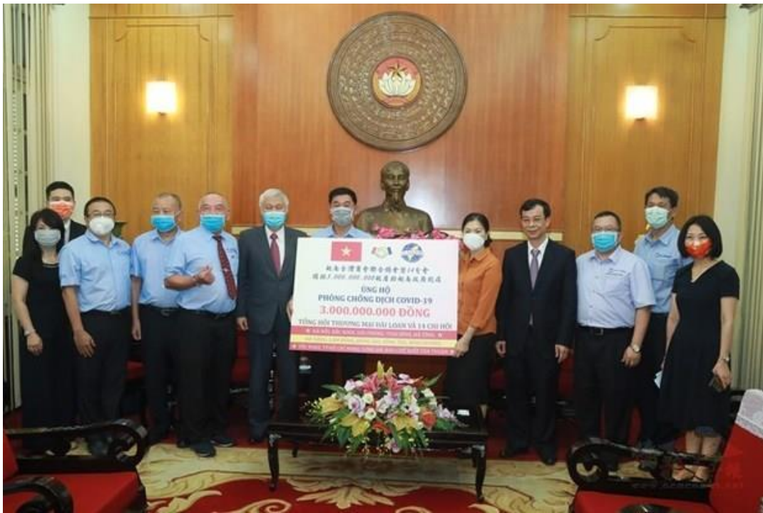
◎越南台灣商會聯合總會暨 14 個地方商會於捐贈約 13 萬美金協助防疫