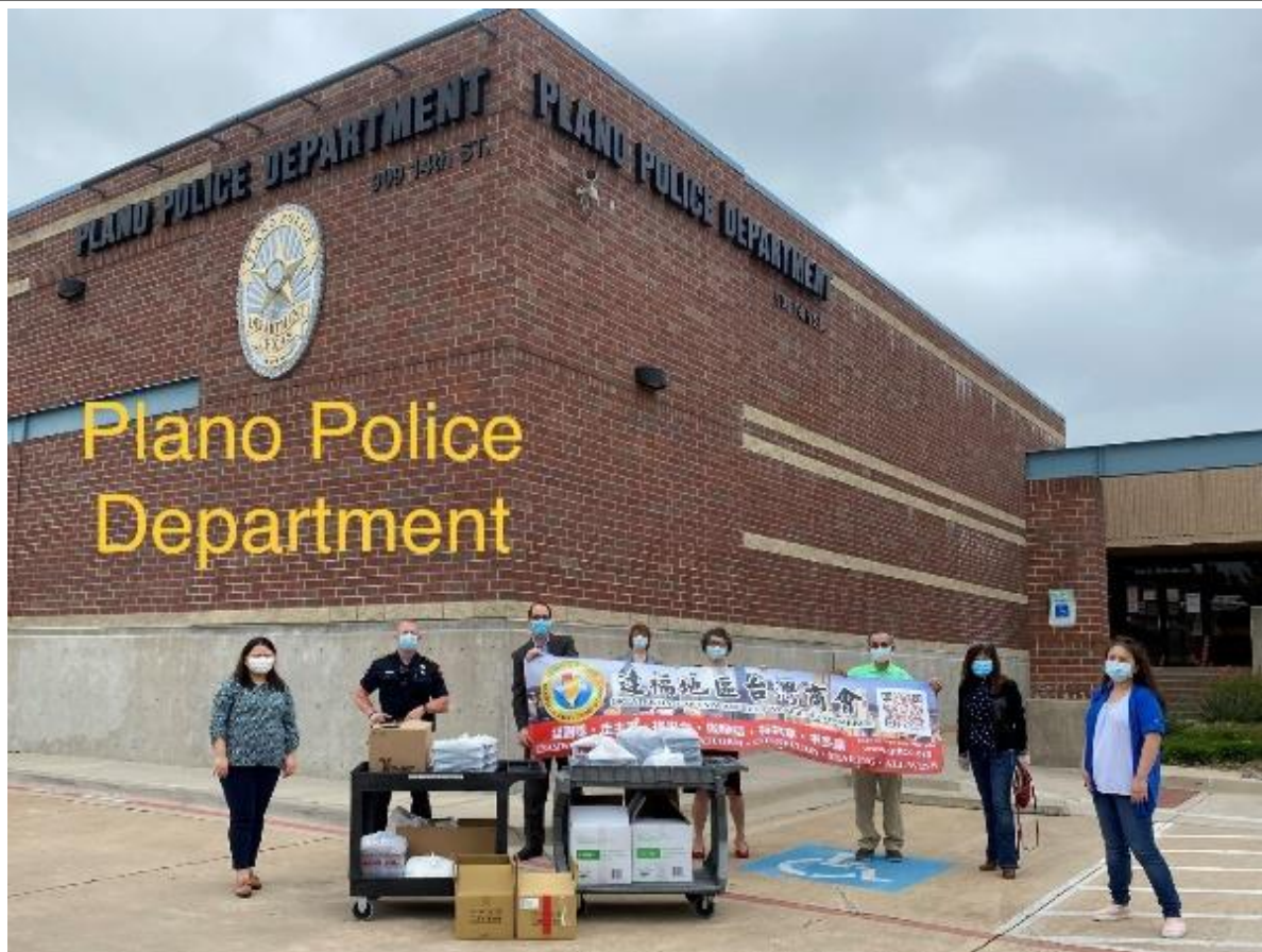
◎達福地區台灣商會送餐至 Plano 警察局