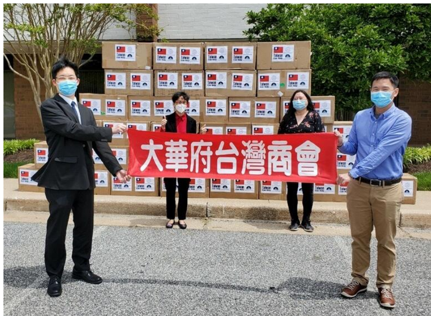
◎大華府台灣商會於馬州州政府捐贈防疫物資