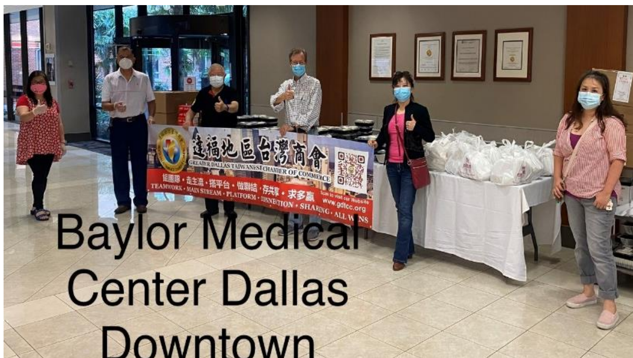
◎達福地區台灣商會送餐至達拉斯醫學中心