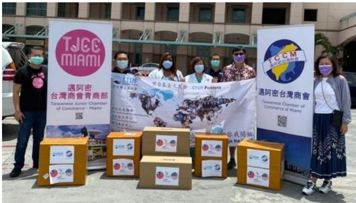
◎邁阿密台商會捐贈防疫物資予 Memorial Health Care System、VA Medical Center if West Palm Hospital