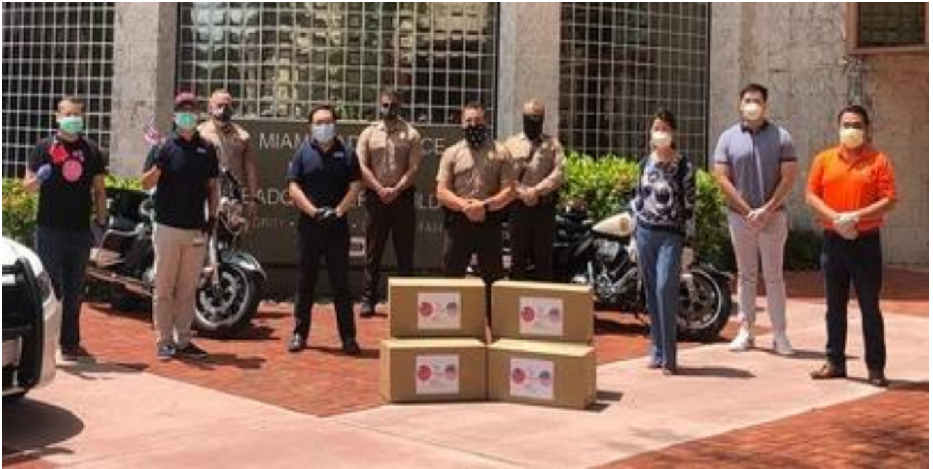
◎邁阿密台商會捐贈防疫物資予南佛州邁戴郡(Miami Dade County)警察局