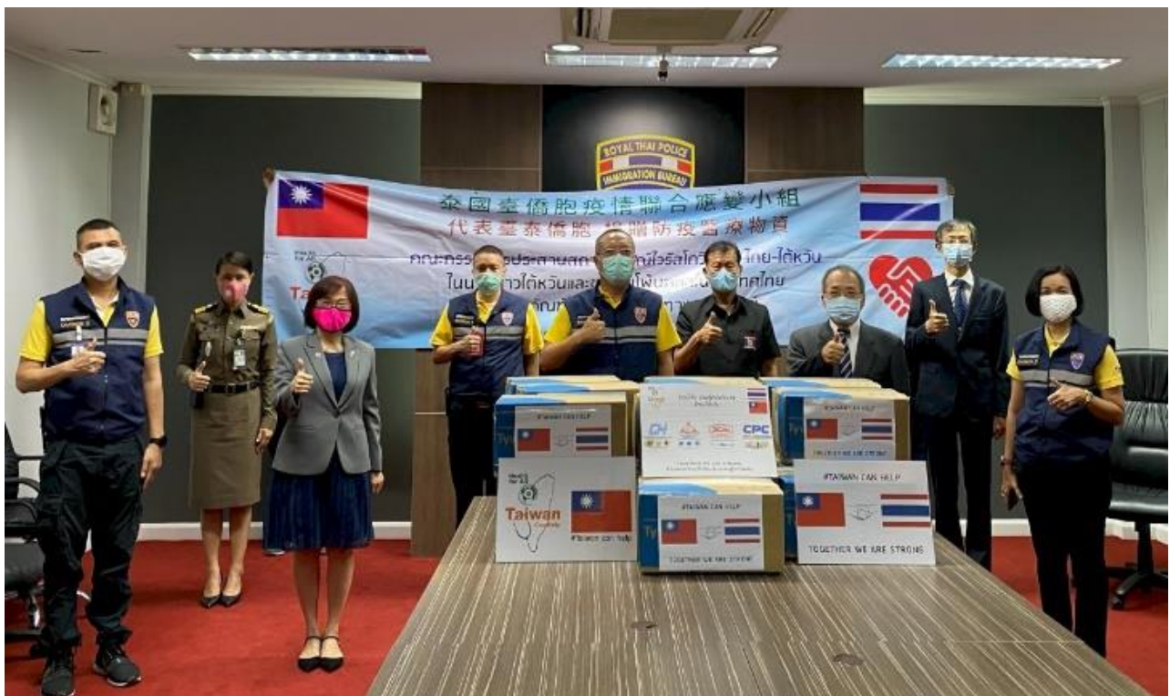
◎泰國台僑胞疫情防疫聯合應變小組贈防疫物資予泰國移民局