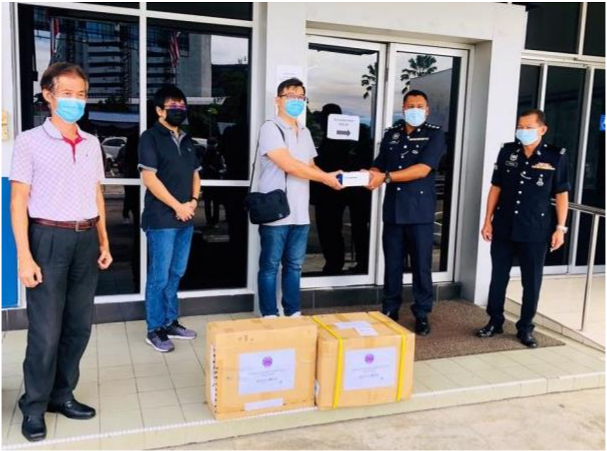
◎馬來西亞台商總會東馬台灣商會捐贈防疫物資予亞庇警區