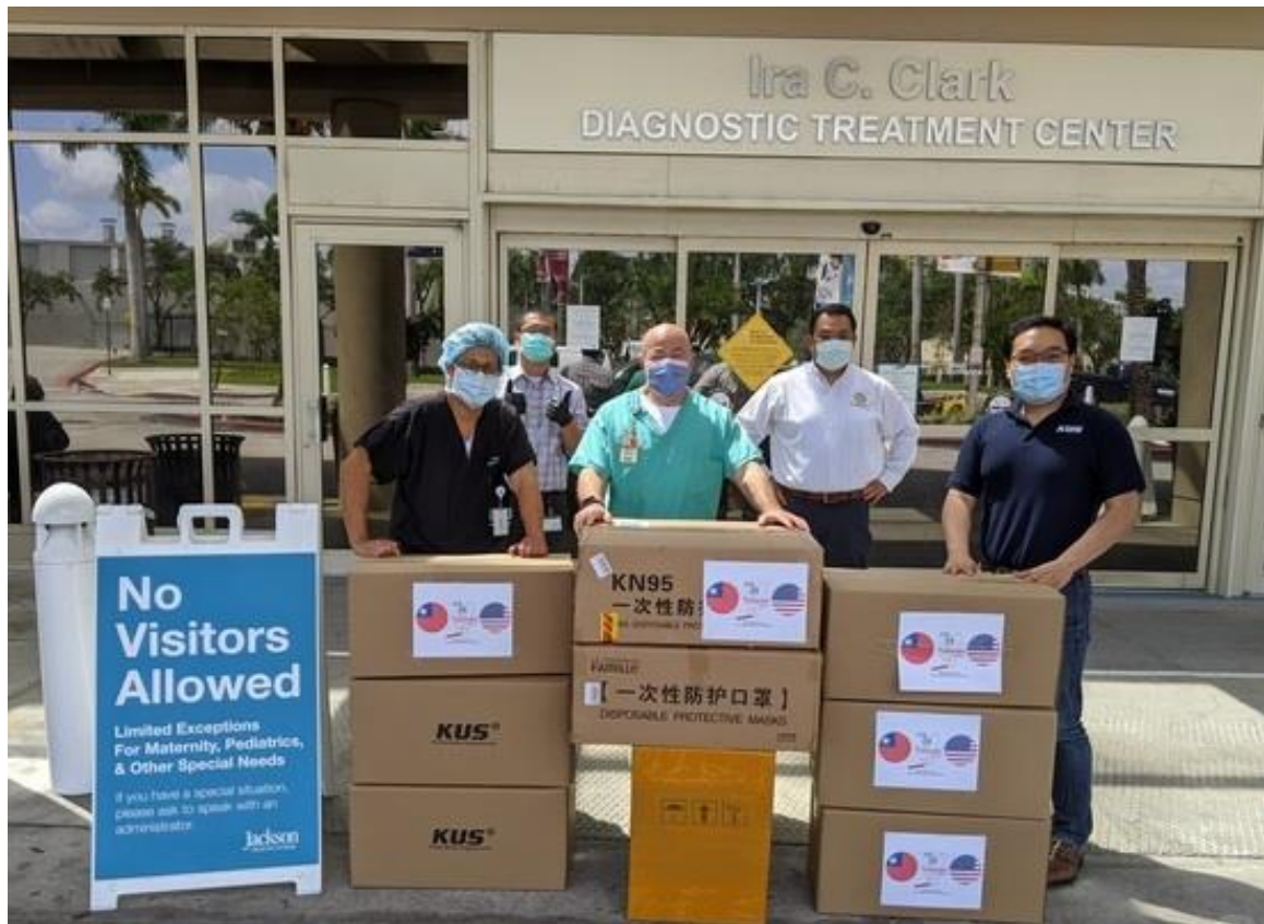
◎邁阿密台商會捐贈防疫物資予 Jackson Memorial Hospital