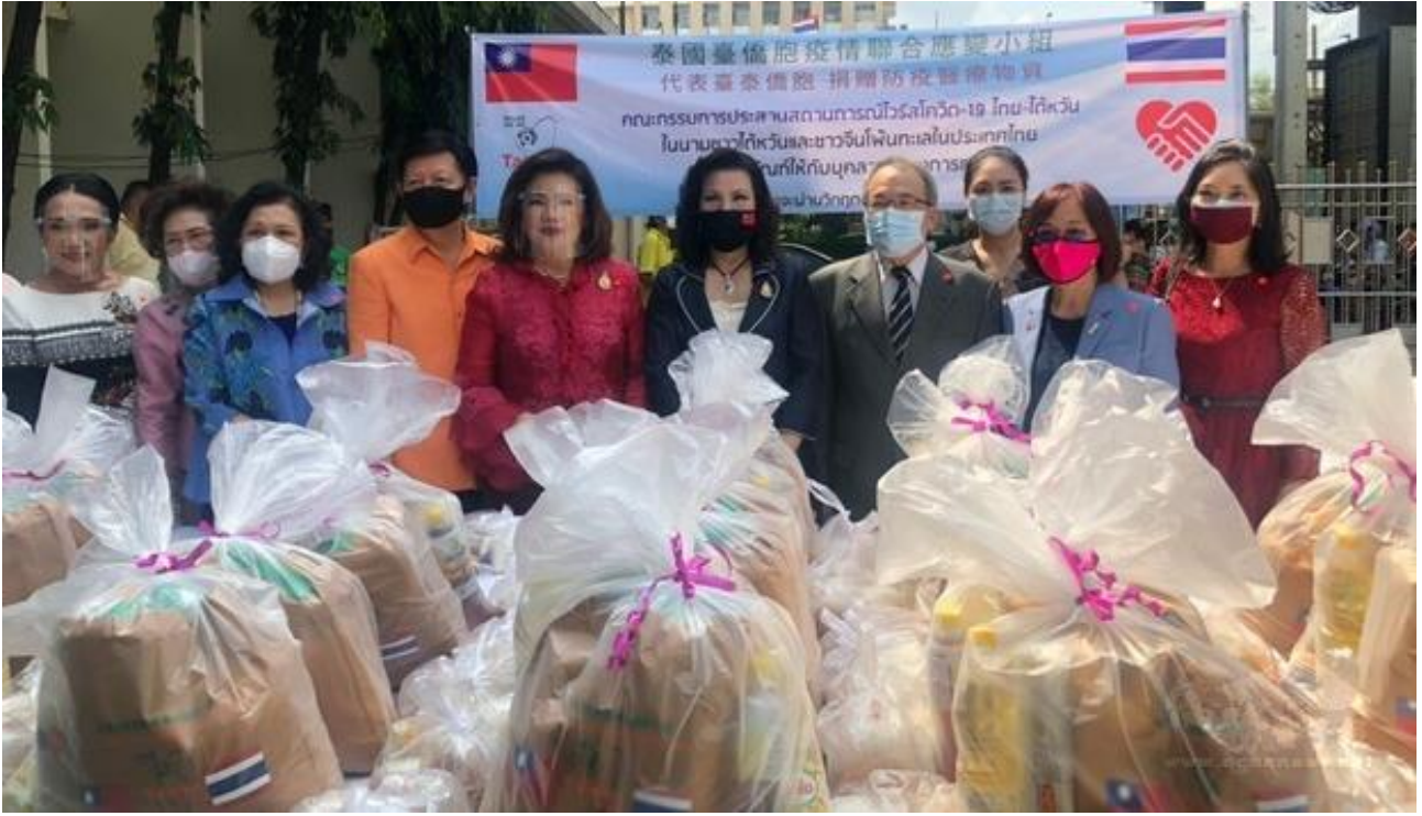
◎泰國台僑胞疫情防疫聯合應變小組贈防疫物資予泰國皇家基金會所屬社會福利委員會