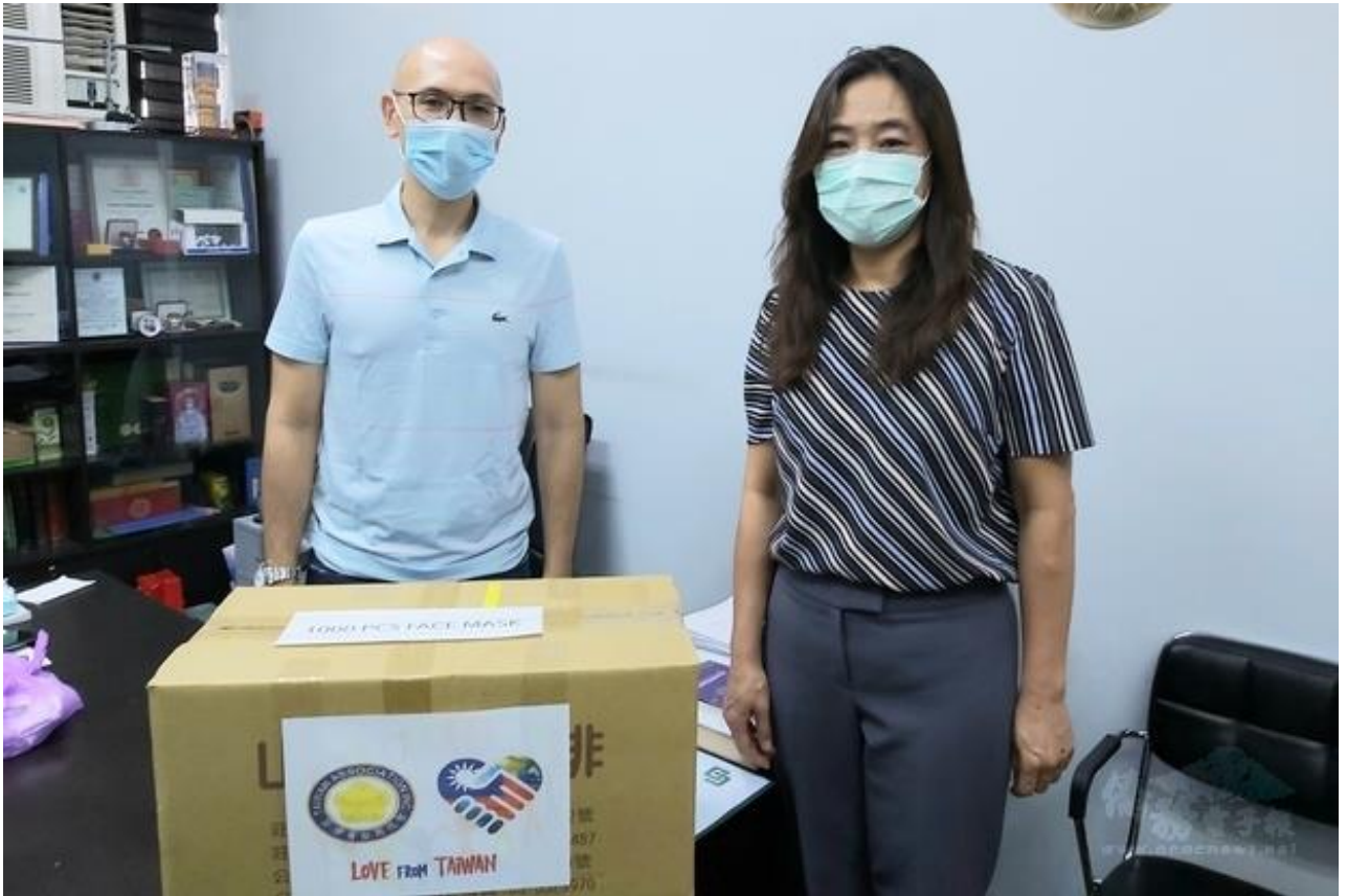
◎菲律賓台灣商會聯合總會贈防疫物資予菲律賓移民局