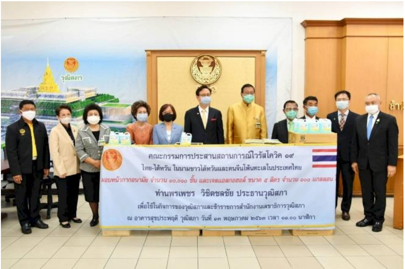
◎泰國台僑胞疫情防疫聯合應變小組贈防疫物資予泰國參議院