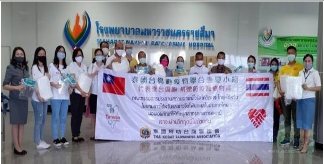
◎泰國台僑胞疫情防疫聯合應變小組贈防疫物資予呵叻府醫院