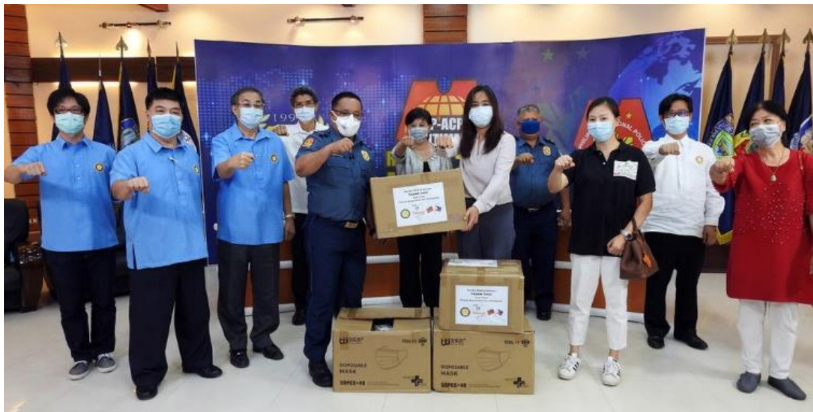
◎菲律賓台灣商會聯合總會贈與防疫物資予中呂宋地區警區