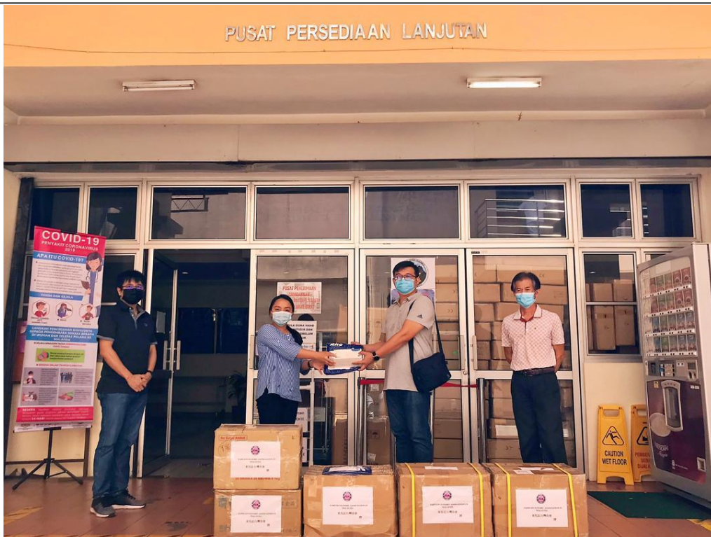
◎馬來西亞台商總會東馬台灣商會捐贈防疫物資予伊莉莎白女皇醫院