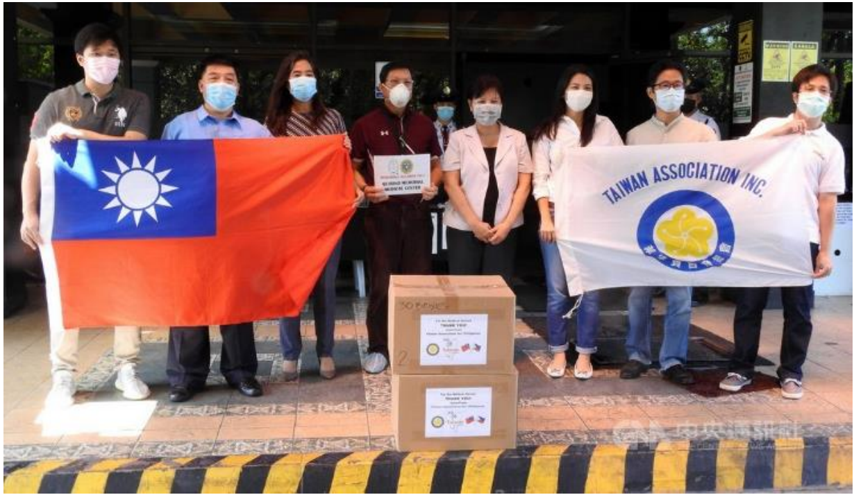
◎菲律賓台灣商會聯合總會贈防疫物資予季里諾紀念醫學中心