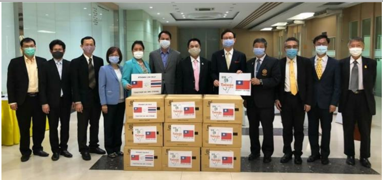
◎泰國台僑胞疫情防疫聯合應變小組贈防疫物資予泰國工業部