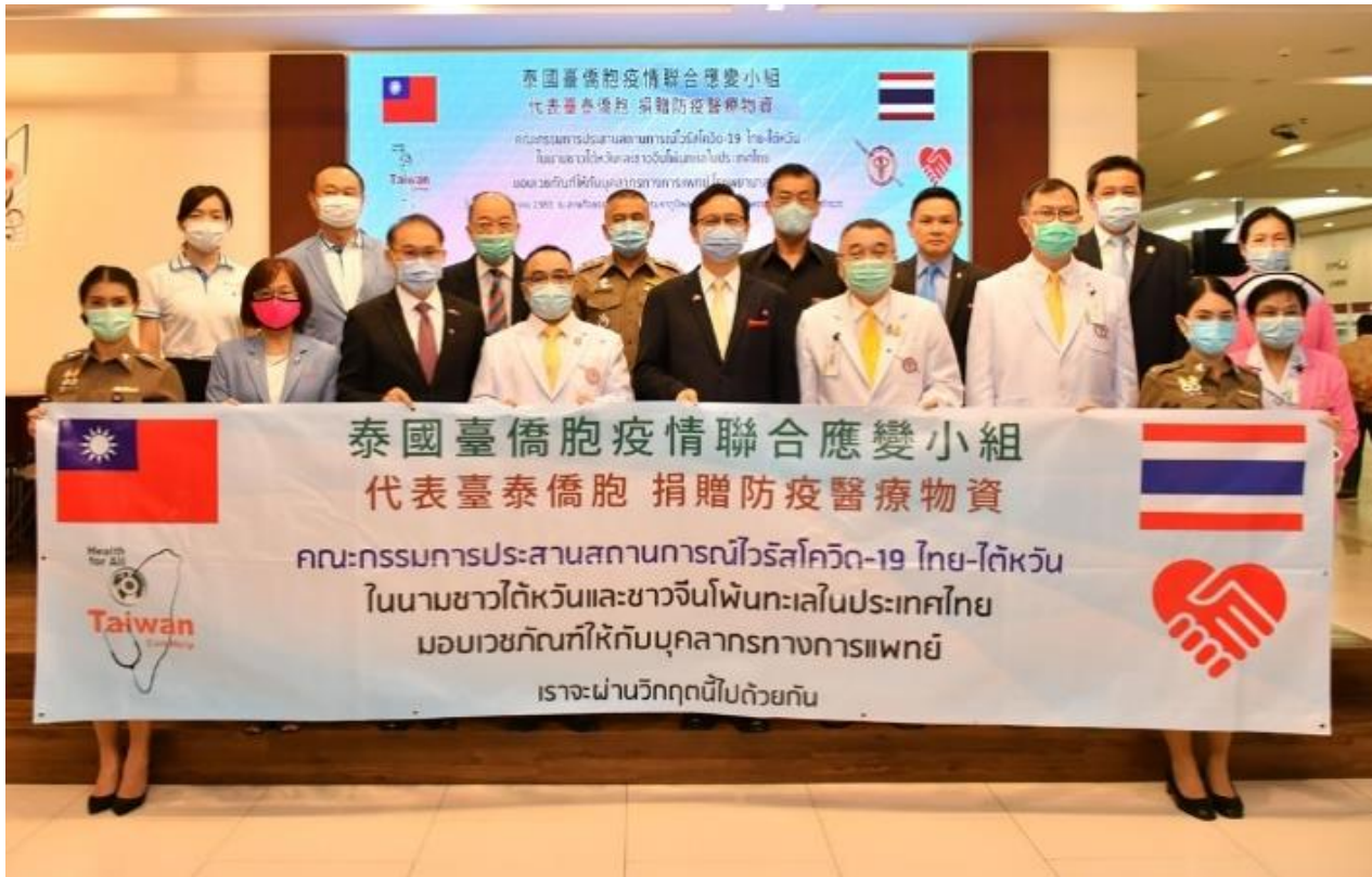
◎泰國台僑胞疫情防疫聯合應變小組贈防疫物資予警政署中央警察總醫院