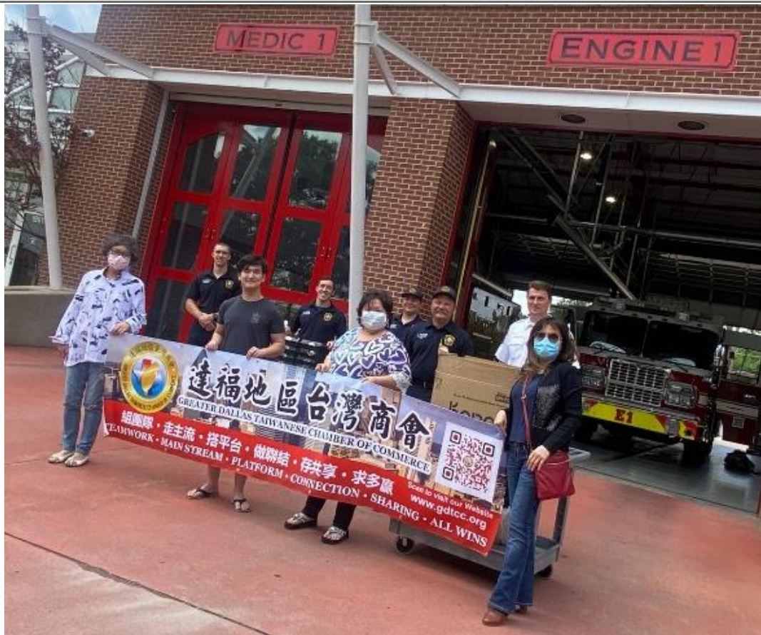
◎達福地區台灣商會送餐至 Plano 消防局