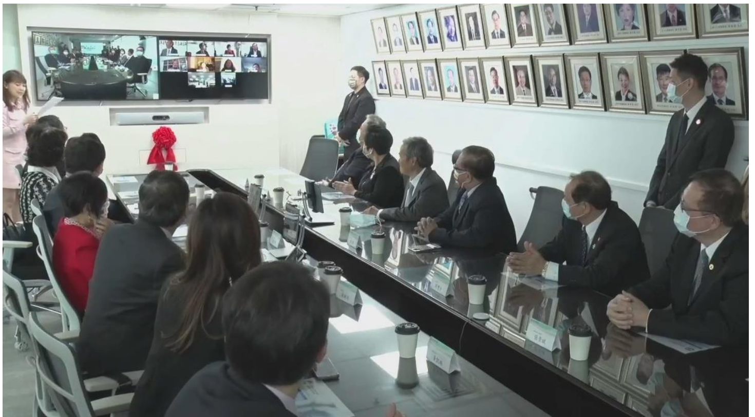
◎遠端線上貴賓與現場貴賓視訊交流