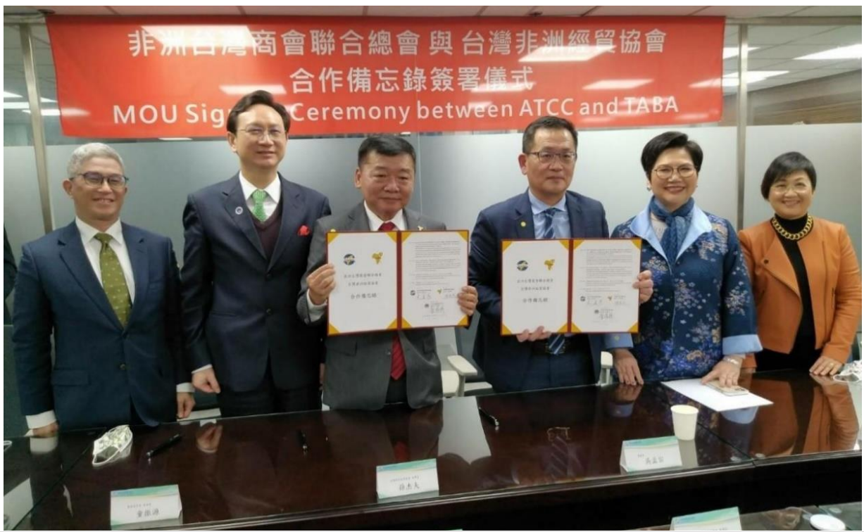
◎非洲台商總會 ATCC 與台灣非洲經貿協會 TABA 簽署合作備忘錄