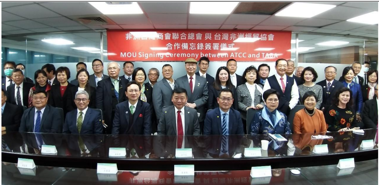
◎部分與會貴賓合影