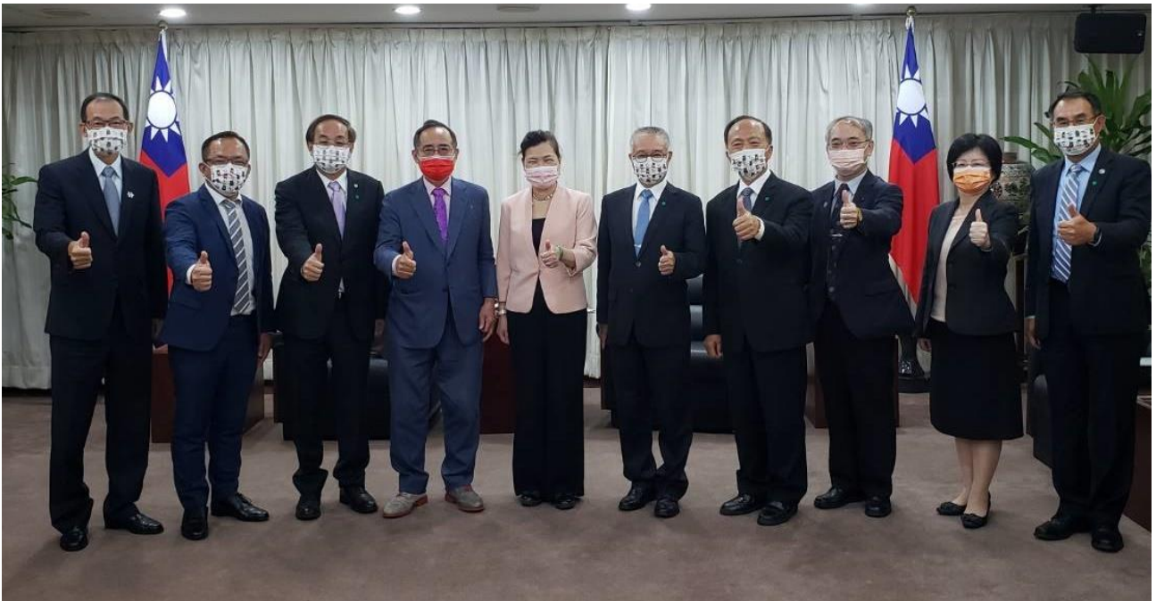
◎訪問團與經濟部王部長美花會後合影留念