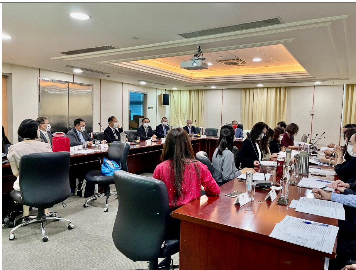
◎訪問團與交通部就各項議題進行交流