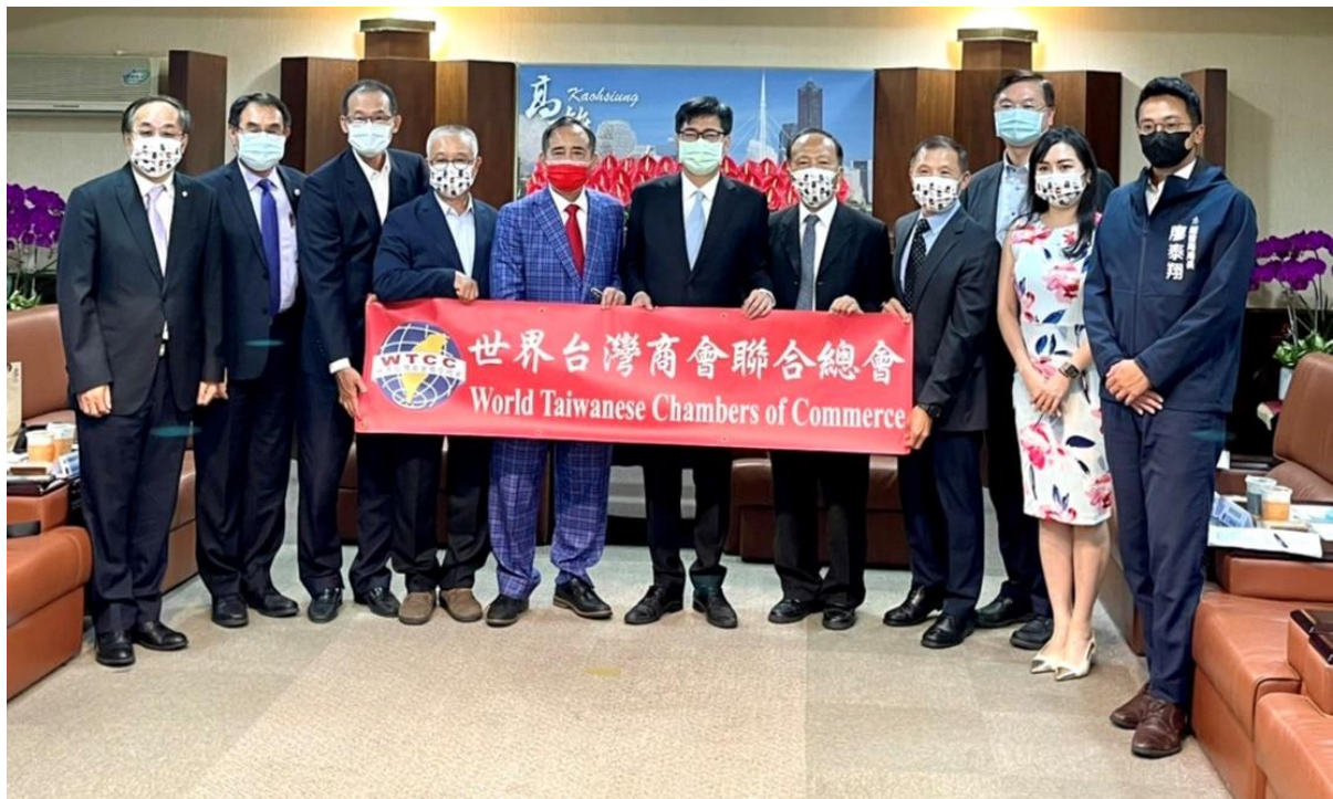
◎高雄市陳市長其邁與訪問團會後合影