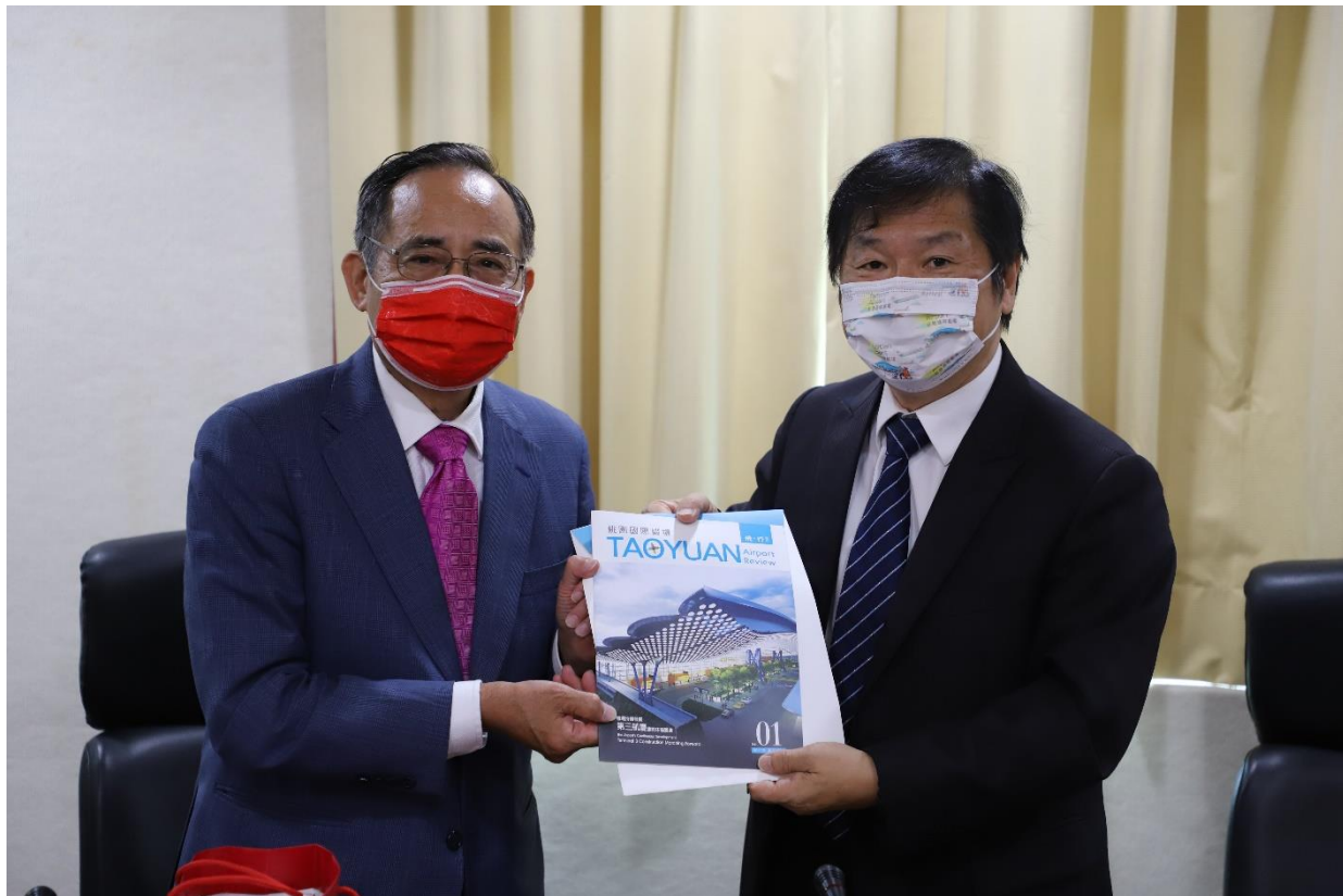
◎交通部次長文中期待未來能在總會的協助下，將臺灣推上世界的舞台。