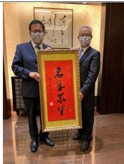
◎桃園市鄭市長文燦贈賀匾予王總會長德及張監事長德輝