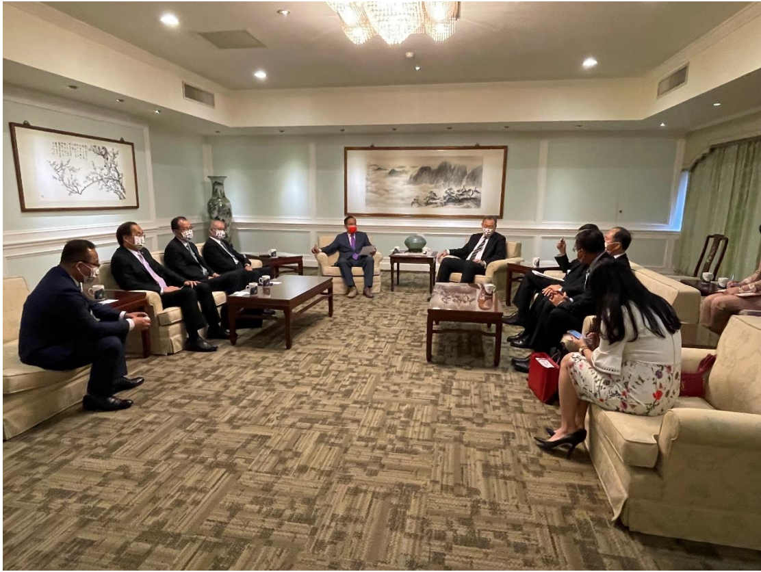
◎訪問團參訪外交部與會情形