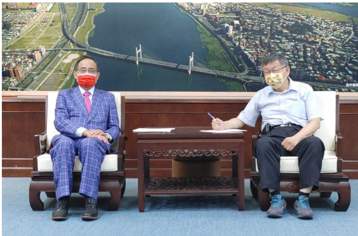
◎王總會長德與台北市柯市長文哲會談情形

柯市長文哲表示，王總會長德預計拜會東歐四國，屆時市府也會準備伴手禮委由總會長團隊致贈與台北市締結姊妹市的首都(捷克首都布拉格市及立陶宛首都維爾紐斯)，藉以鞏固雙邊情誼，訪談交流氣氛相當熱絡，相談甚歡。