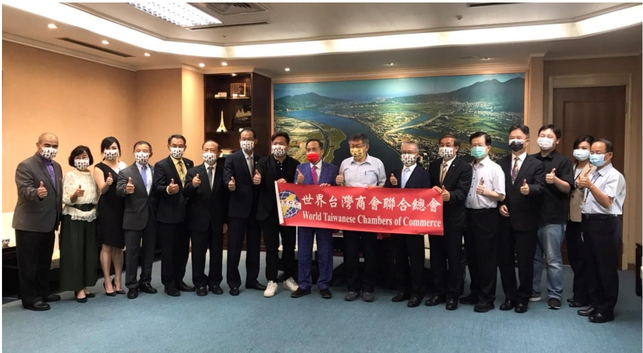
◎王總會長德偕同訪問團與台北市柯市長文哲合影留念