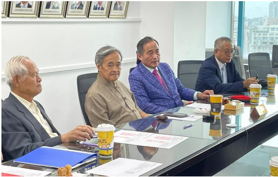
◎新舊任總會長及監事長行政移交