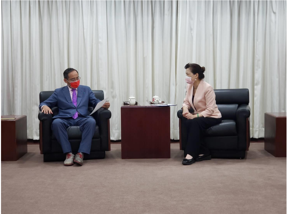
◎王總會長德感謝經濟部協作編撰台商經貿投資白皮書