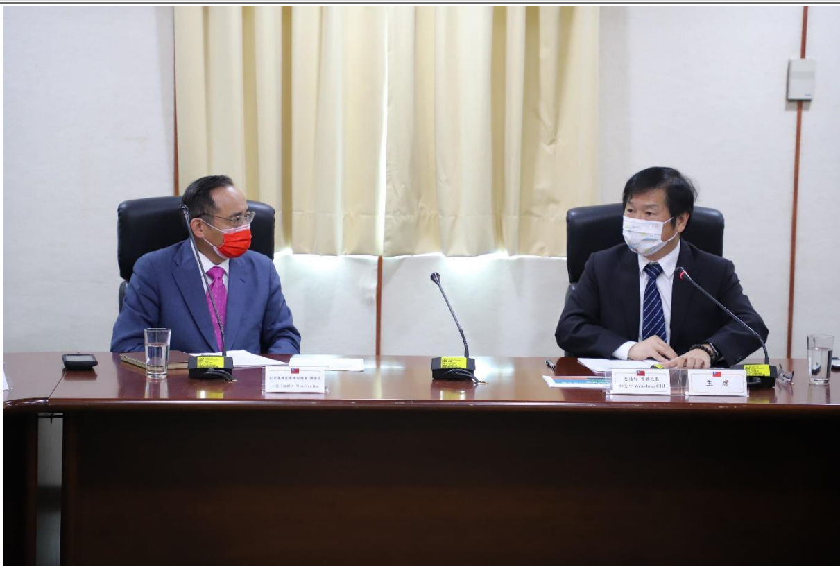
◎王總會長德率訪問團拜會交通部祈次長文中