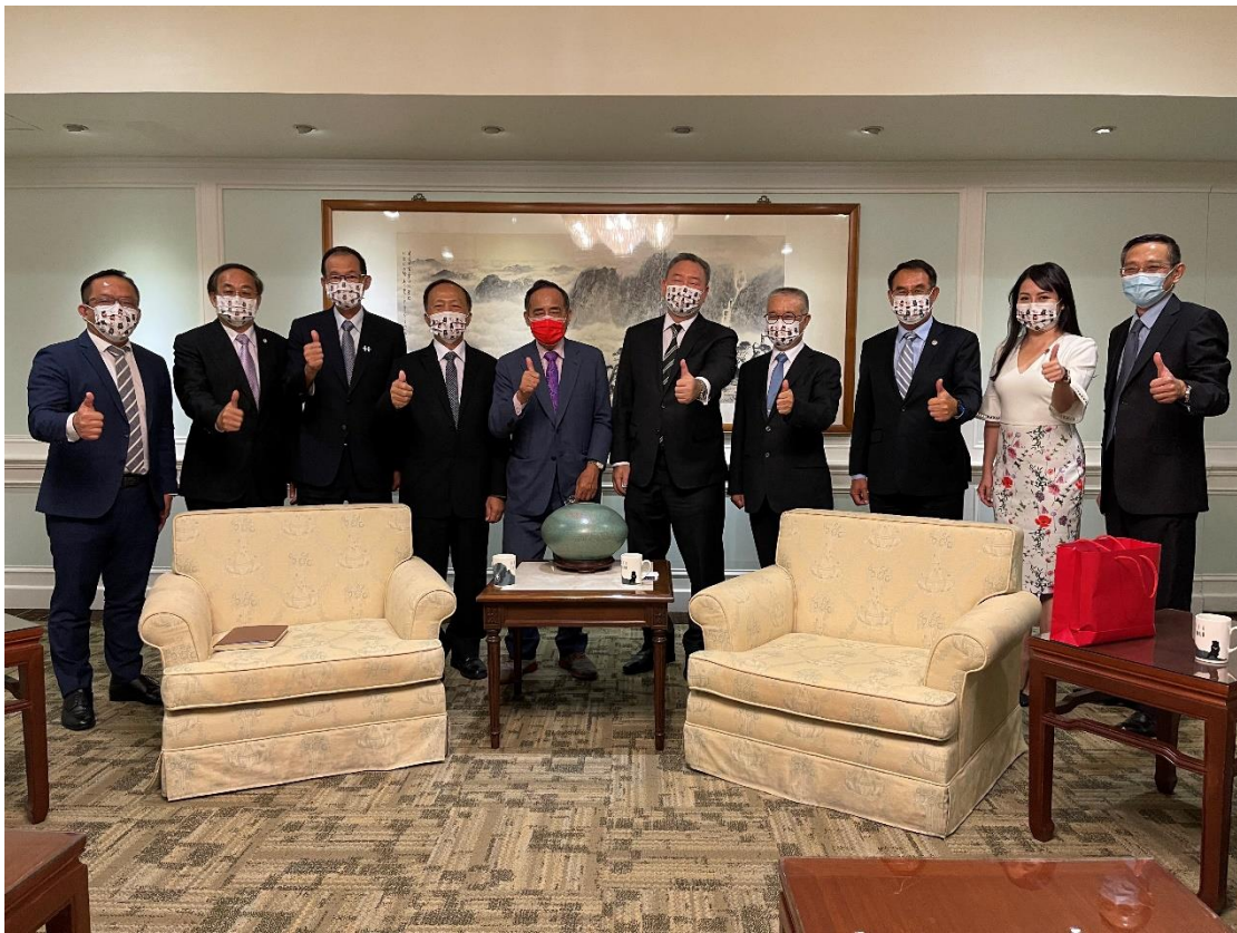
◎與外交部俞次長會後開心合照