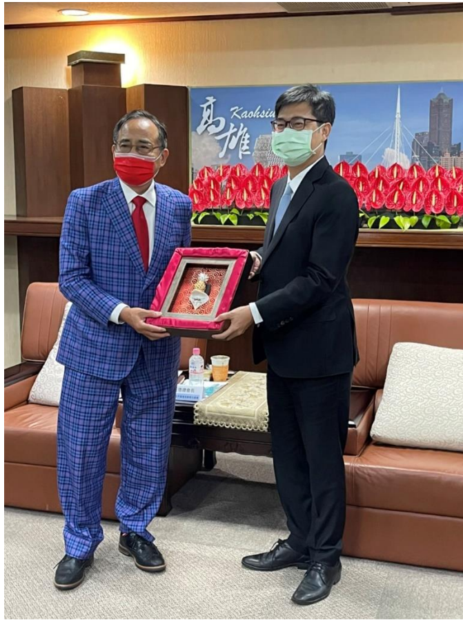
◎王總會長德與高雄市陳市長其邁互贈紀念品