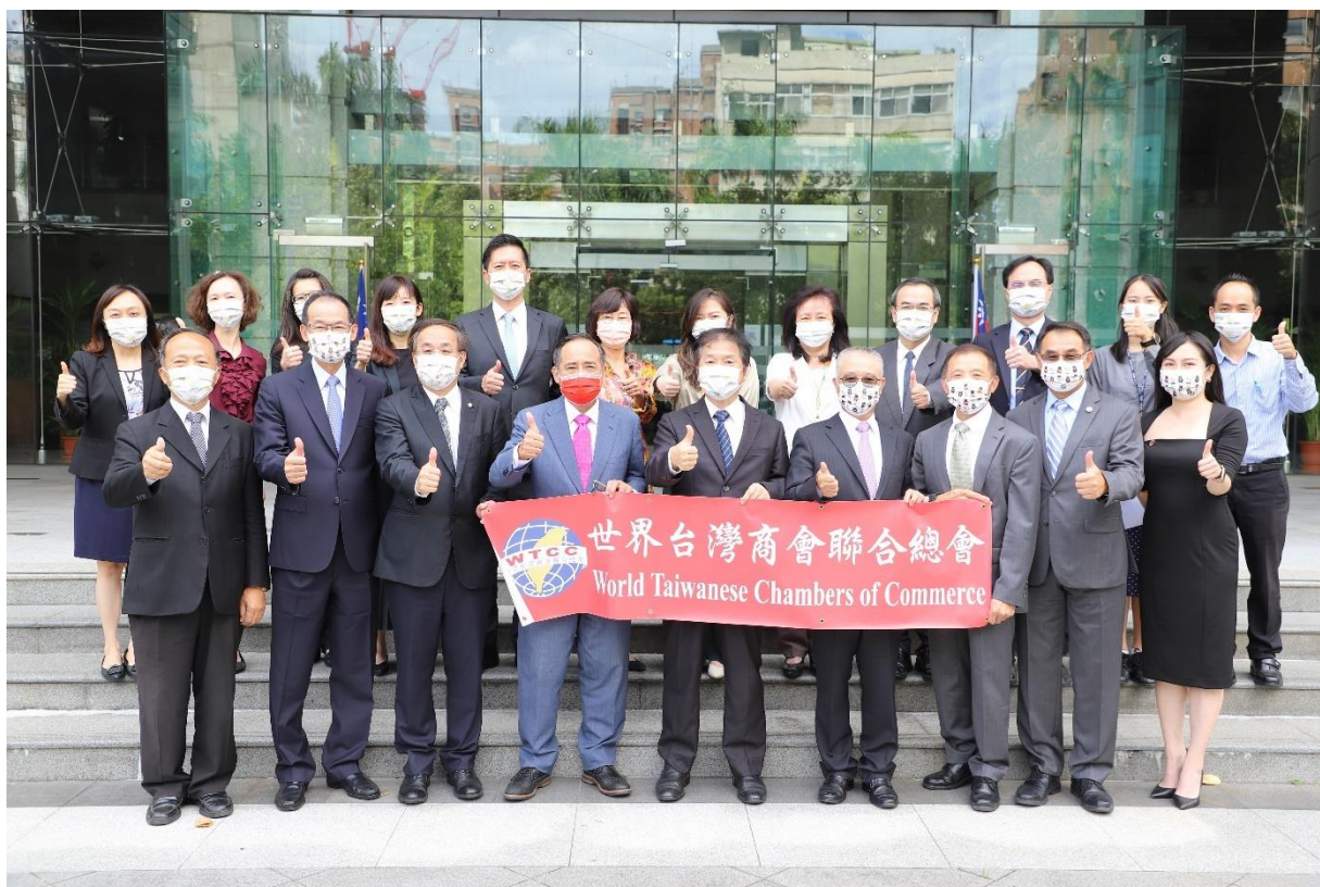
◎與交通部次長文中會後開心合影