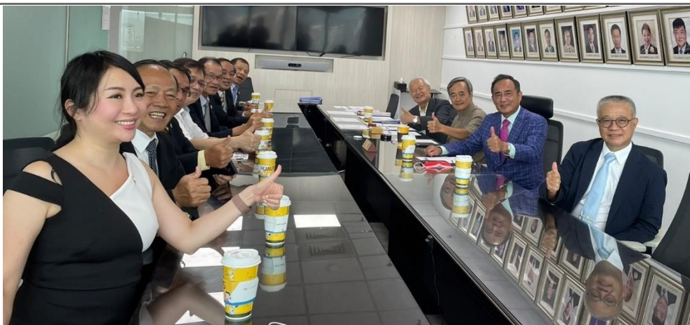
◎交接儀式圓滿順利