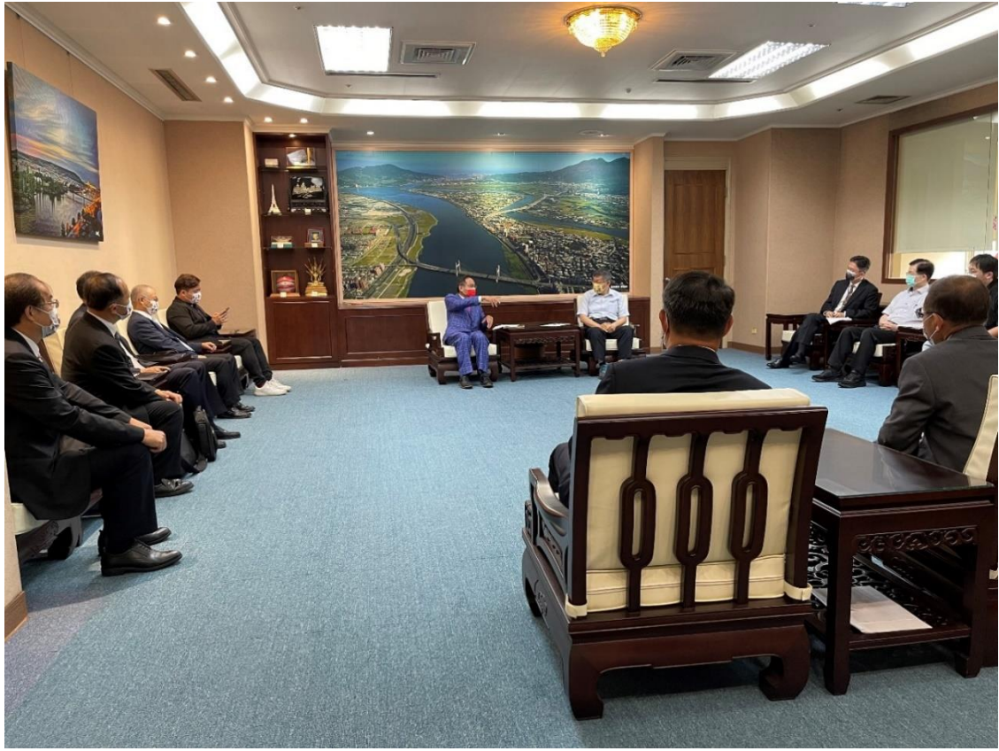
◎雙方相談甚歡，氣氛熱絡