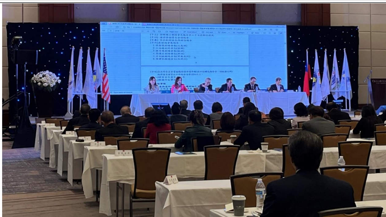
◎理監事會議開會現場情形