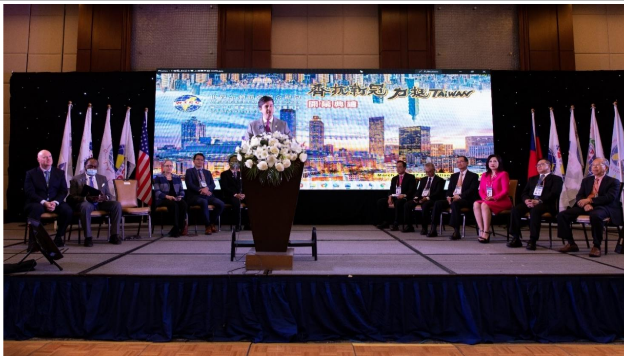
◎喬治亞州參議員 Matt Brass 致詞表示歡迎大家從世界各地前來亞特蘭大參與會議