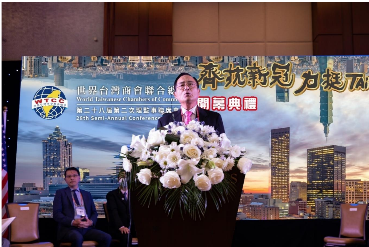
◎王總會長德感謝大家蒞臨亞特蘭大與會