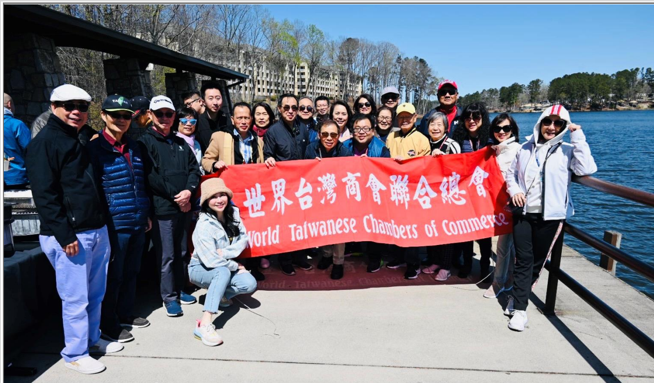
◎王總會長德招待亞特蘭大一日遊