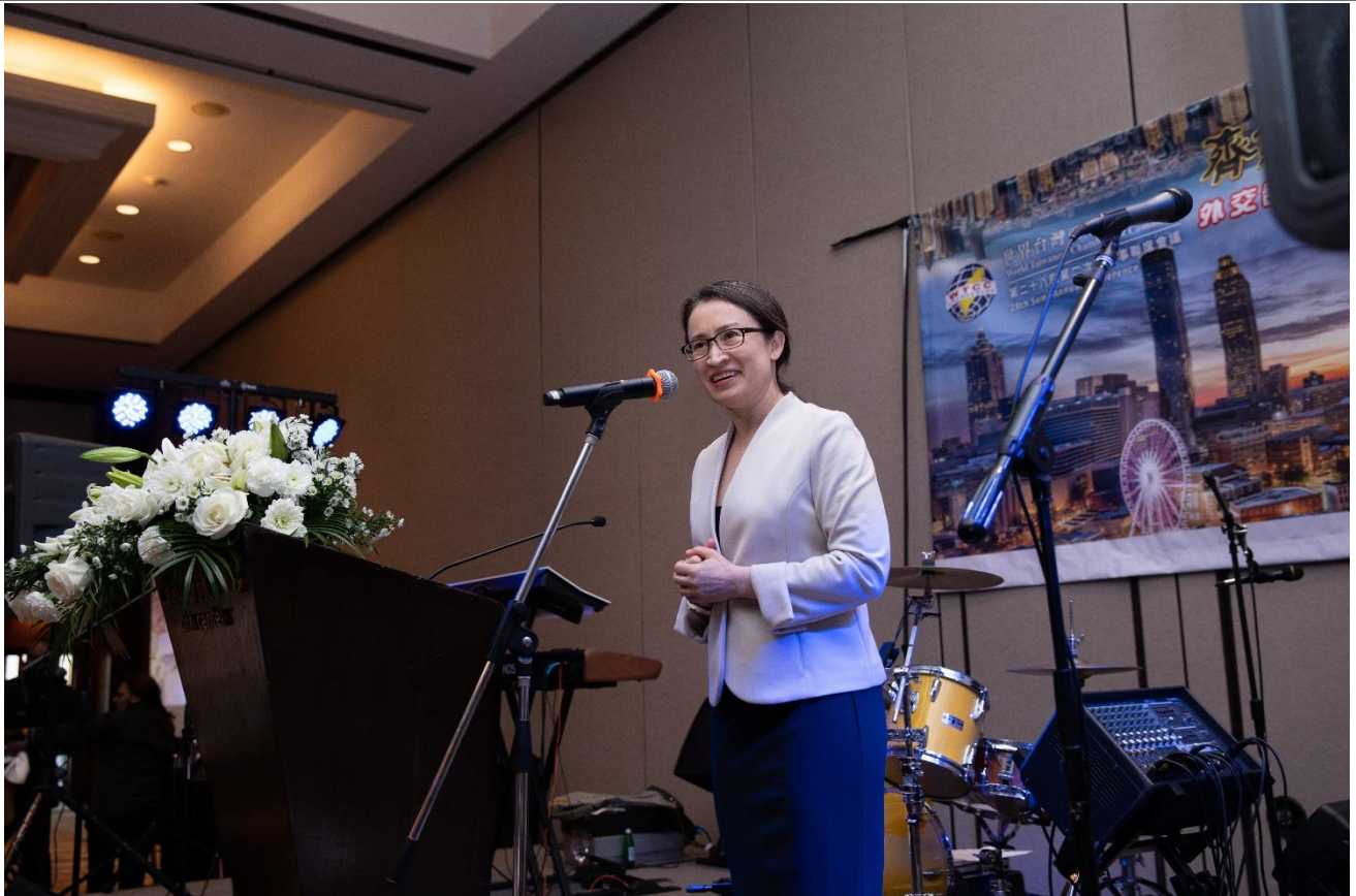
◎蕭美琴大使出席外交部晚宴並致詞