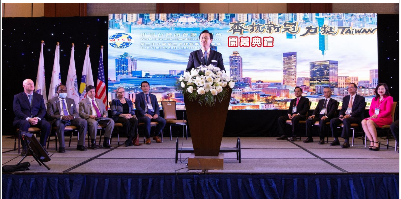
◎僑務委員會童委員長振源親臨開幕典禮現場致賀