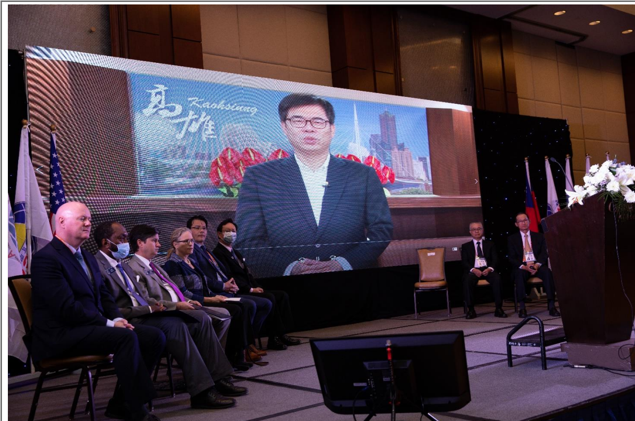
◎高雄市陳市長其邁錄製影片致詞