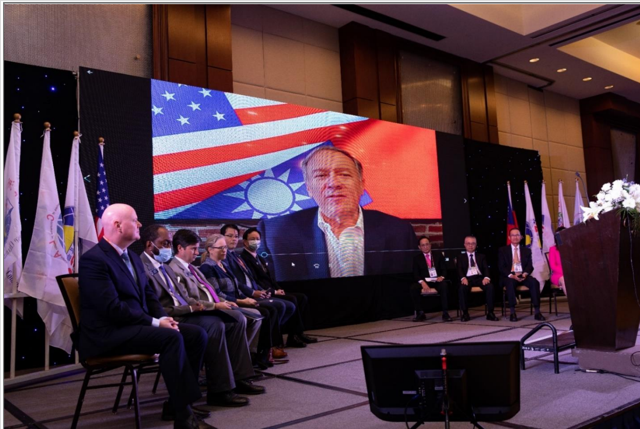
◎美國前國務卿 Pompeo 預錄影片祝大會成功