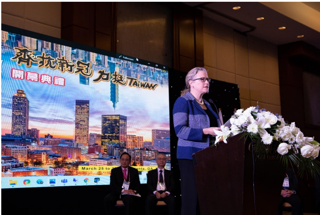
◎聯邦眾議員 Carolyn Bourdeaux 致詞表達對台灣的支持