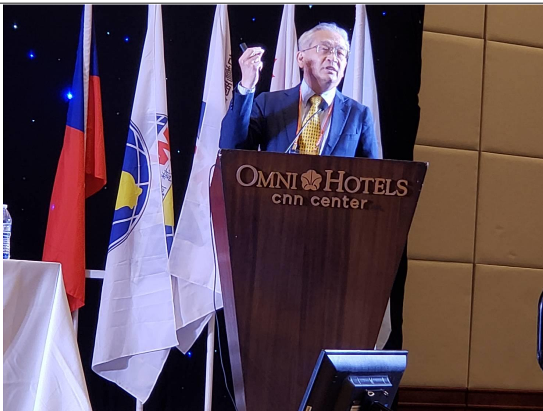
◎鴻海科技集團李前副董事長傑分享「工業人工智能在智能製造轉型經驗分享」