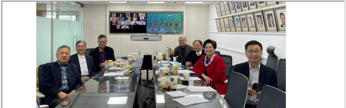
◎常務理事會議實體及線上委員合照