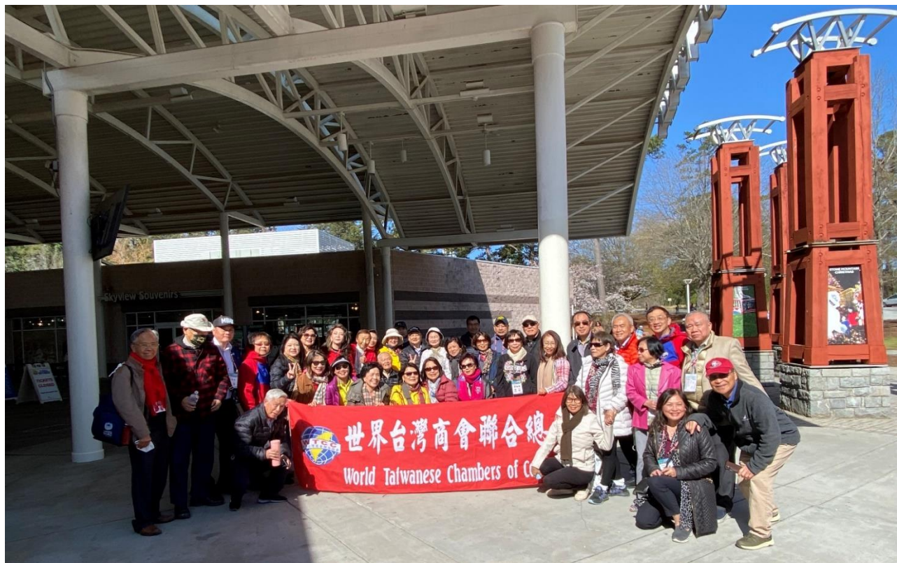
◎王總會長德招待亞特蘭大一日遊