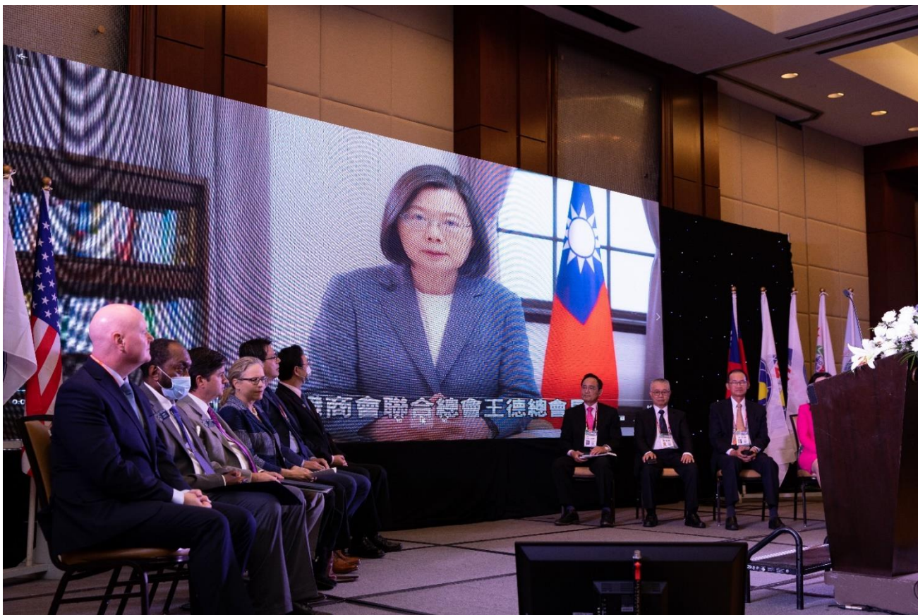
◎蔡總統英文錄製影片預祝大會成功圓滿