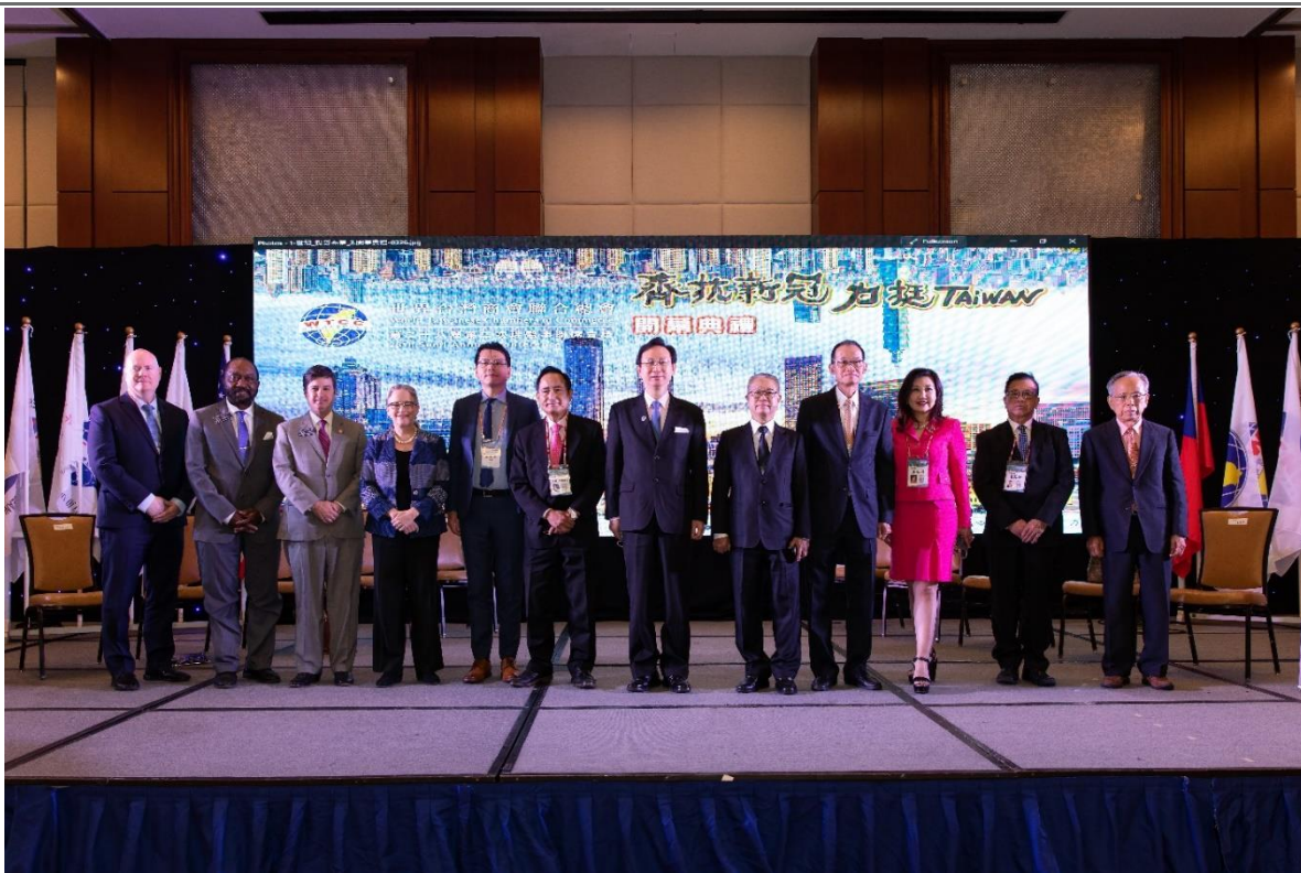
◎開幕典禮台上貴賓合影