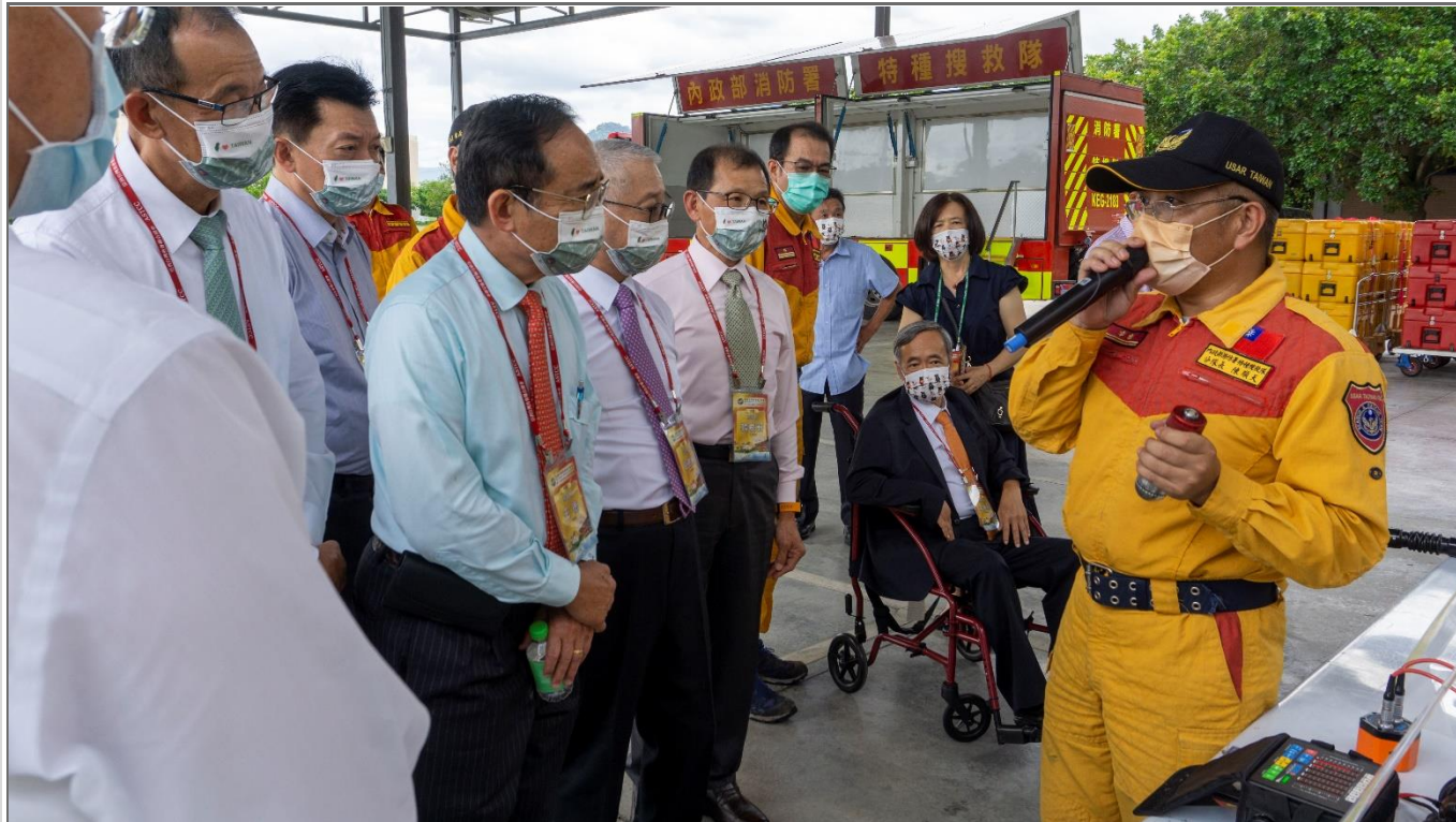
◎消防署特種搜救隊成員演練本次捐贈之消防儀器