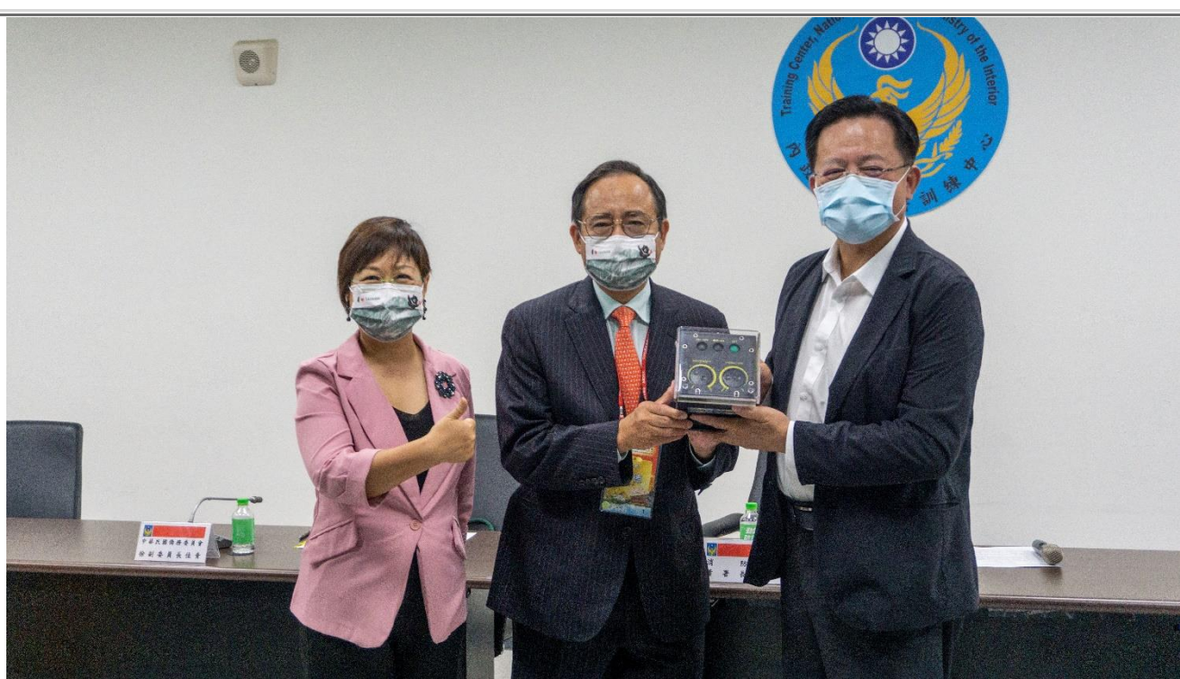
◎王總會長德贈地震坍塌救援壓力警報偵測儀由內政部消防署蕭署長煥章(右)受贈，僑委會徐副委員長佳青(左)見證。