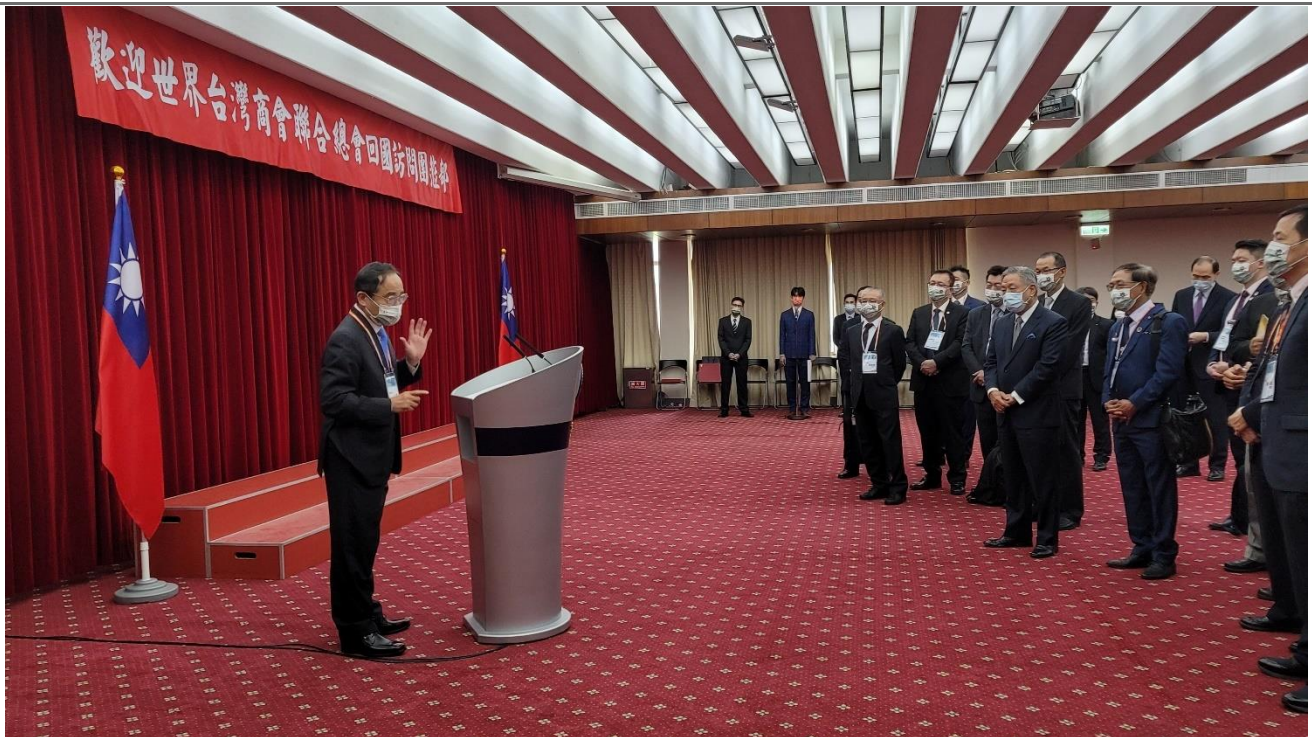
◎拜會外交部並就台灣經貿議題進行討論