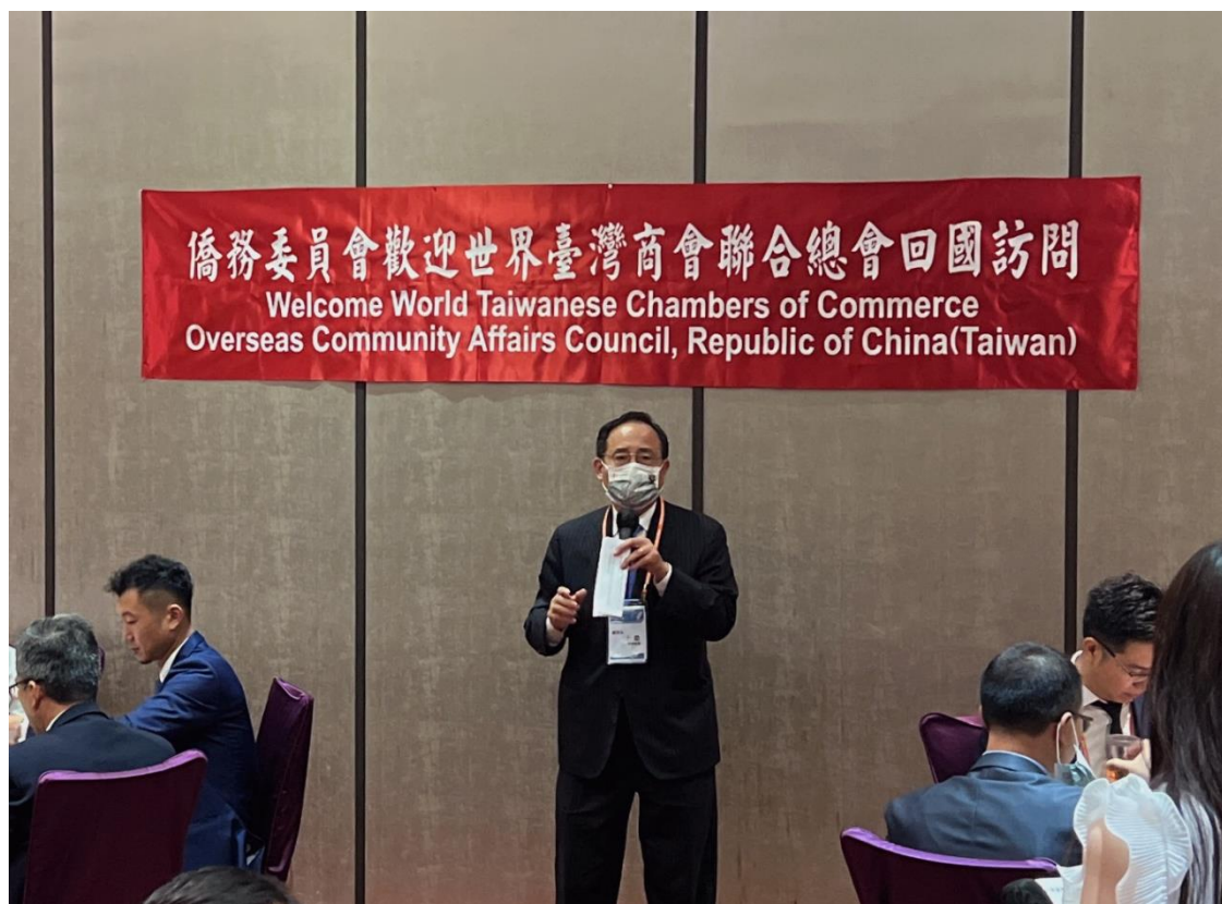
◎王總會長德於拜會僑務委員會暨歡迎晚宴致詞