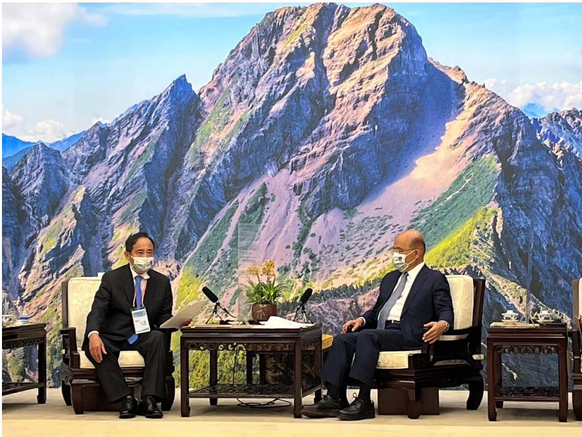
◎王總會長德就邊境管制議題與行政院蘇院長貞昌進行討論