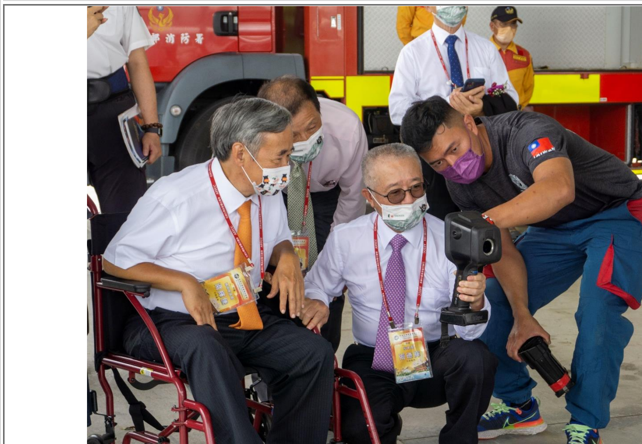
◎消防署特種搜救隊成員演練紅外線熱顯像儀