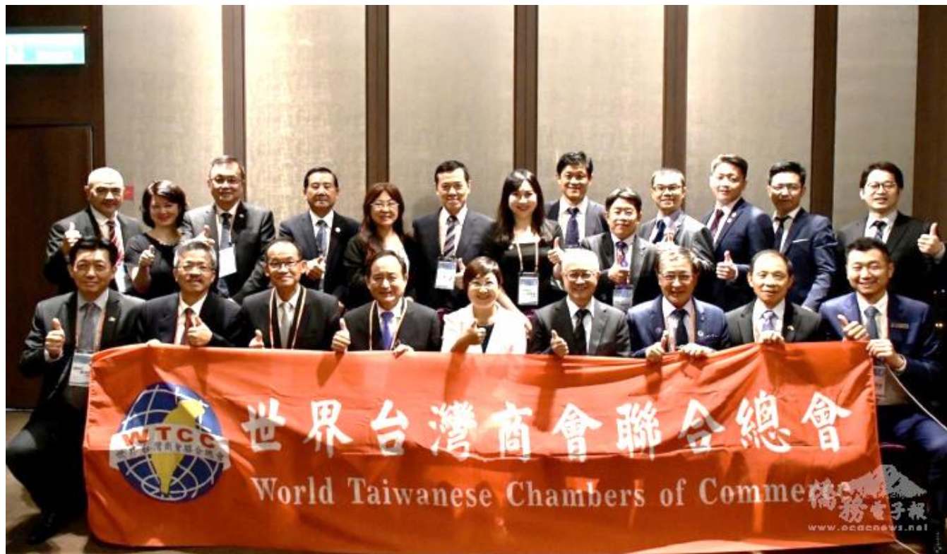
◎拜會僑務委員會並合照