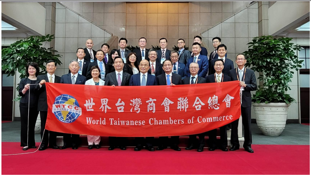
◎訪問團與行政院蘇院長貞昌、僑務委員會徐佳青副委員長、經濟部陳正祺次長、外交部田中光次長、行政院羅秉成政務委員等人合照