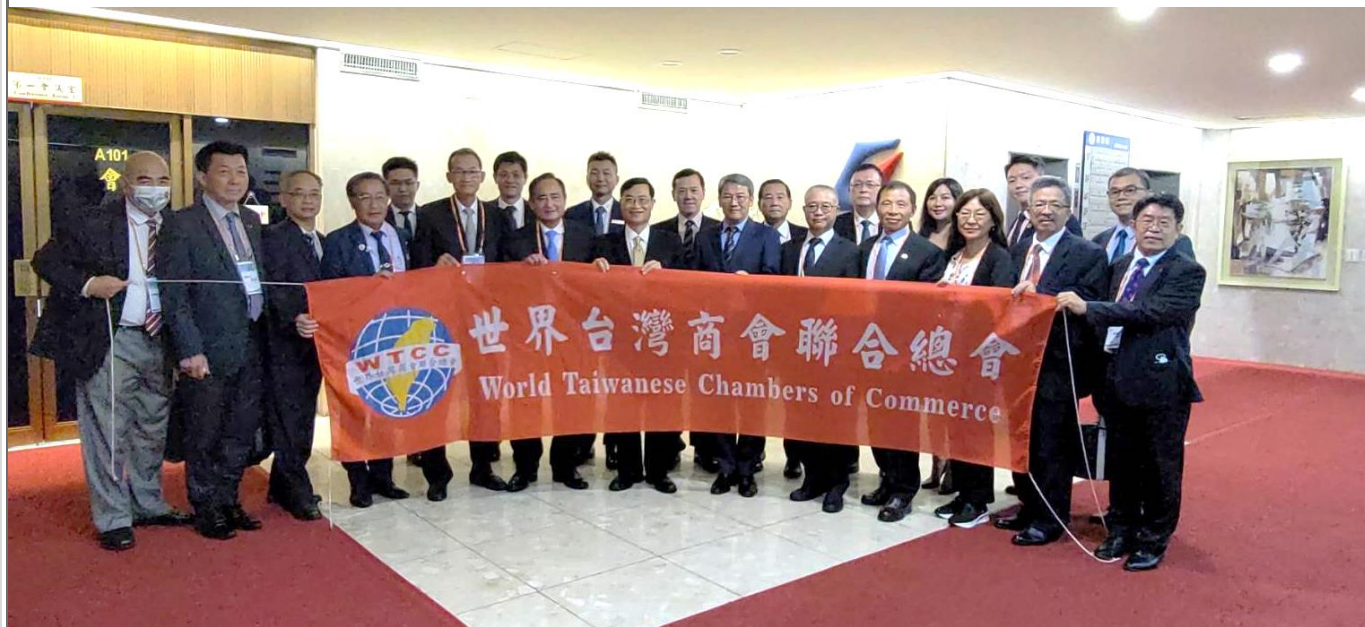
◎訪問團與經濟部陳次長正祺會後合照