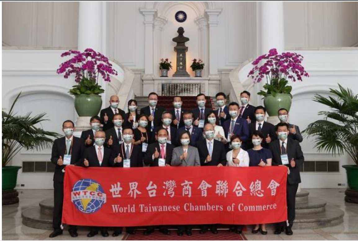
◎訪問團與蔡總統英文合影