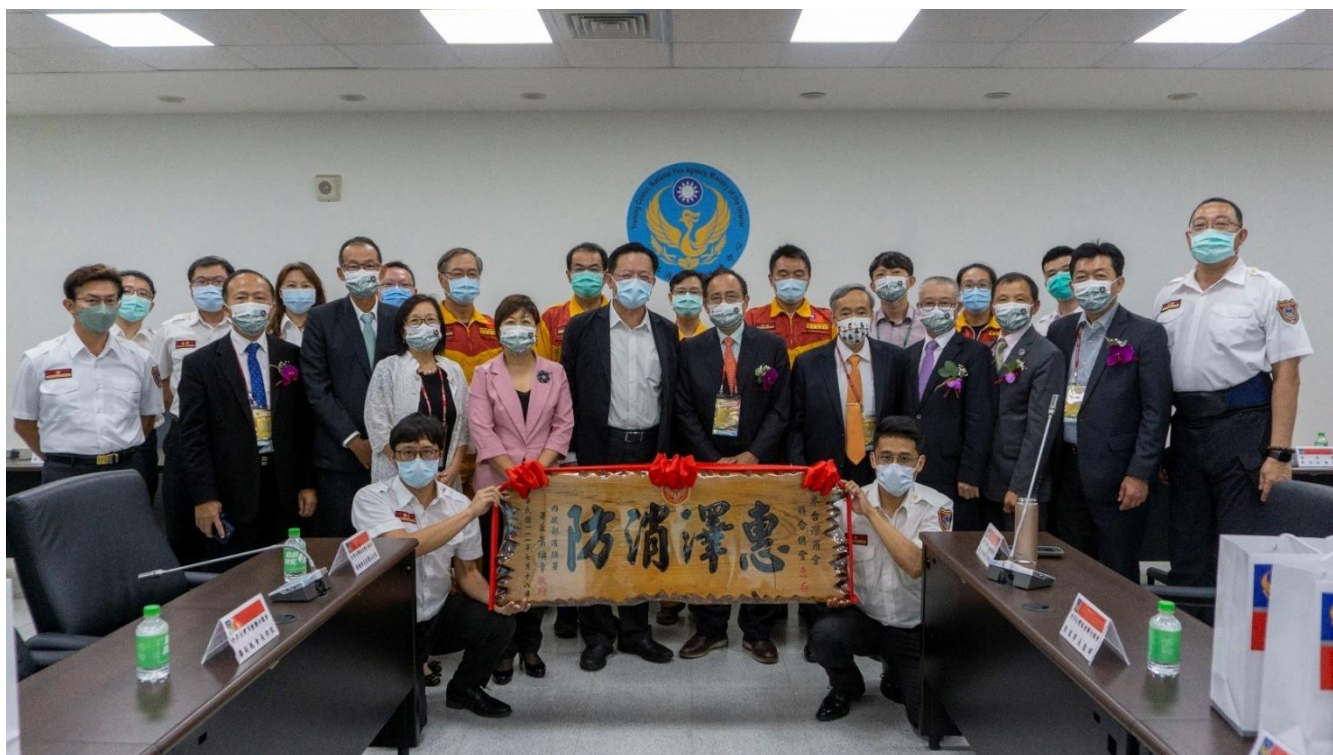
◎受贈單位回贈感謝匾額