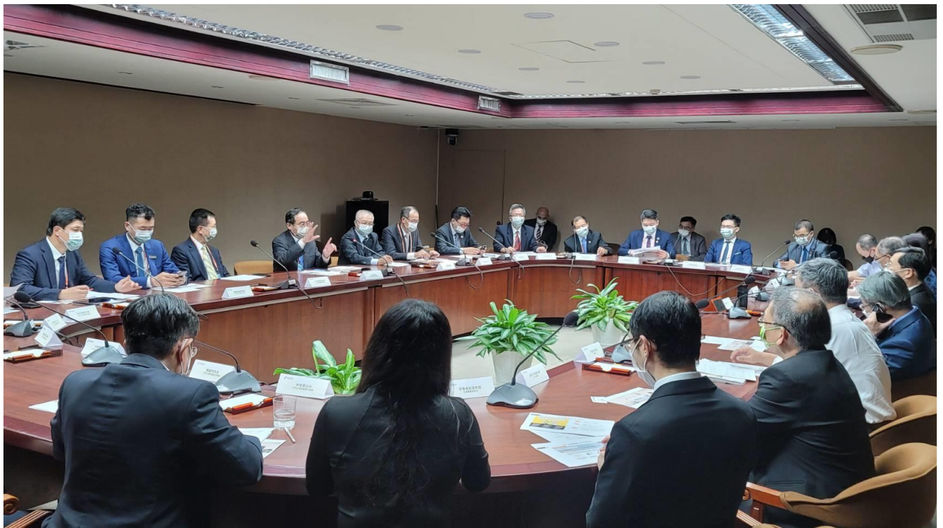
◎王總會長德表示，凝聚全球台商力量協助台灣加入 CPTPP。