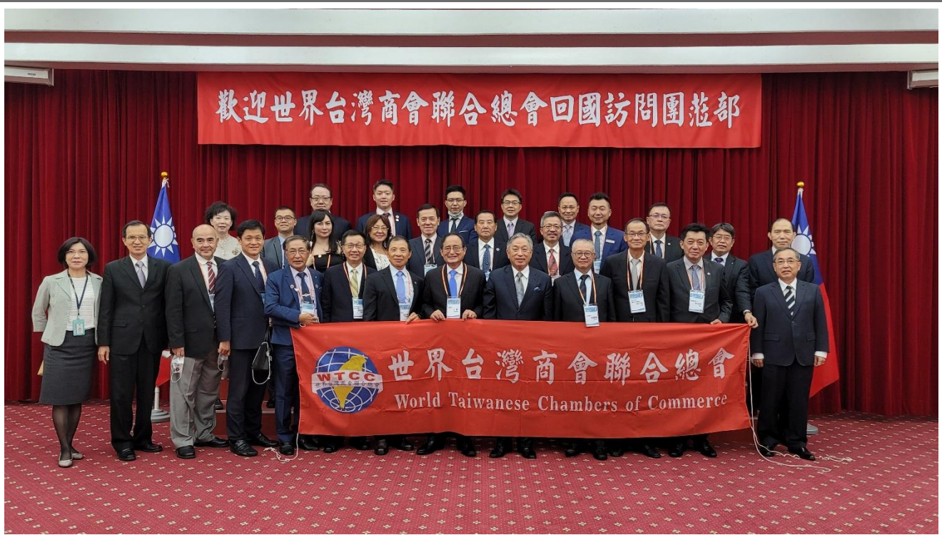
◎訪問團與外交部田次長中光合影