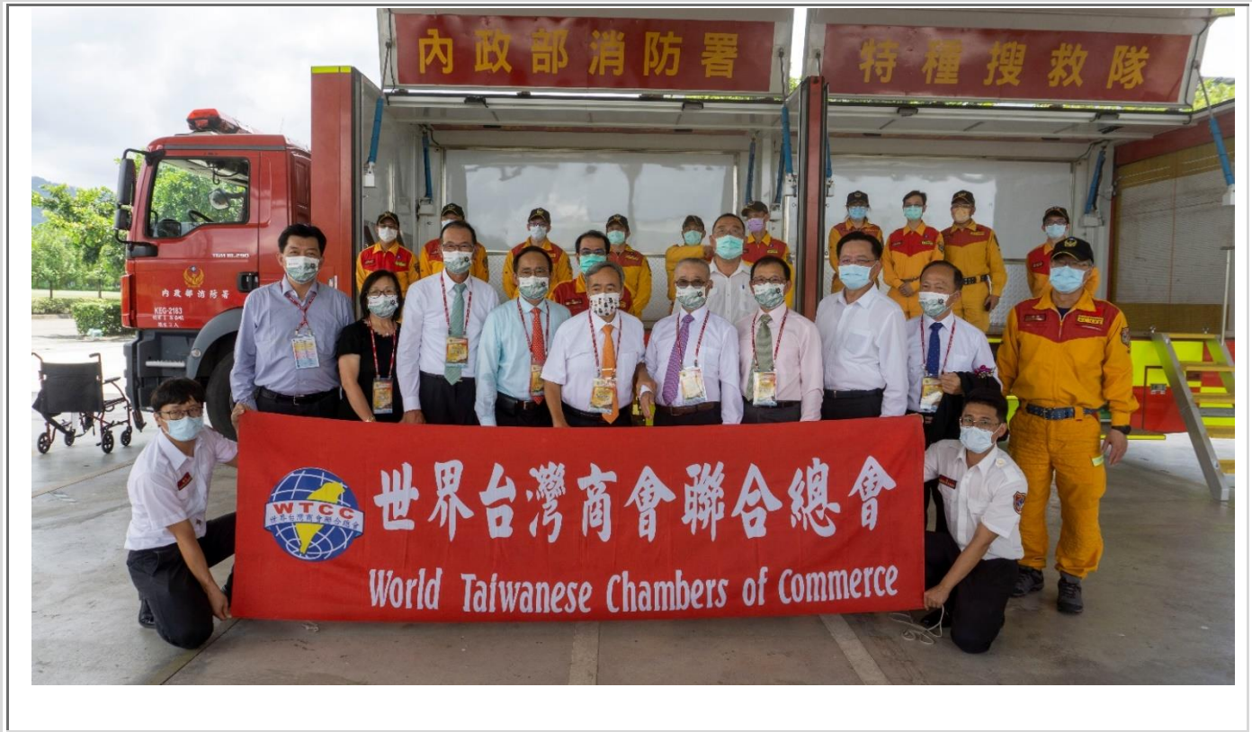
◎王總會長德等人、內政部消防署蕭署長煥章(右 3)與特種搜救隊成員合影