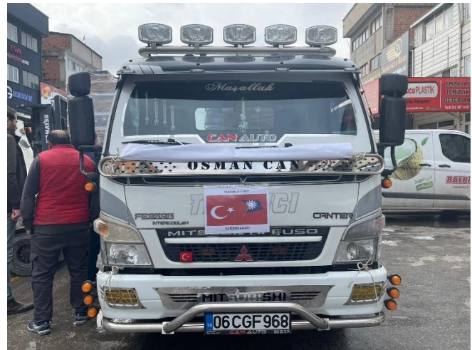
◎土耳其台灣商會採購一大卡車應急物資，支援賑災工作。