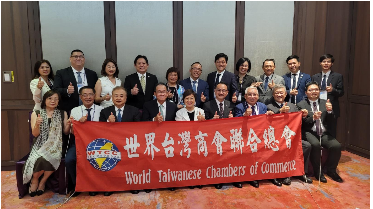
◎與僑務委員會徐委員長佳青合影。