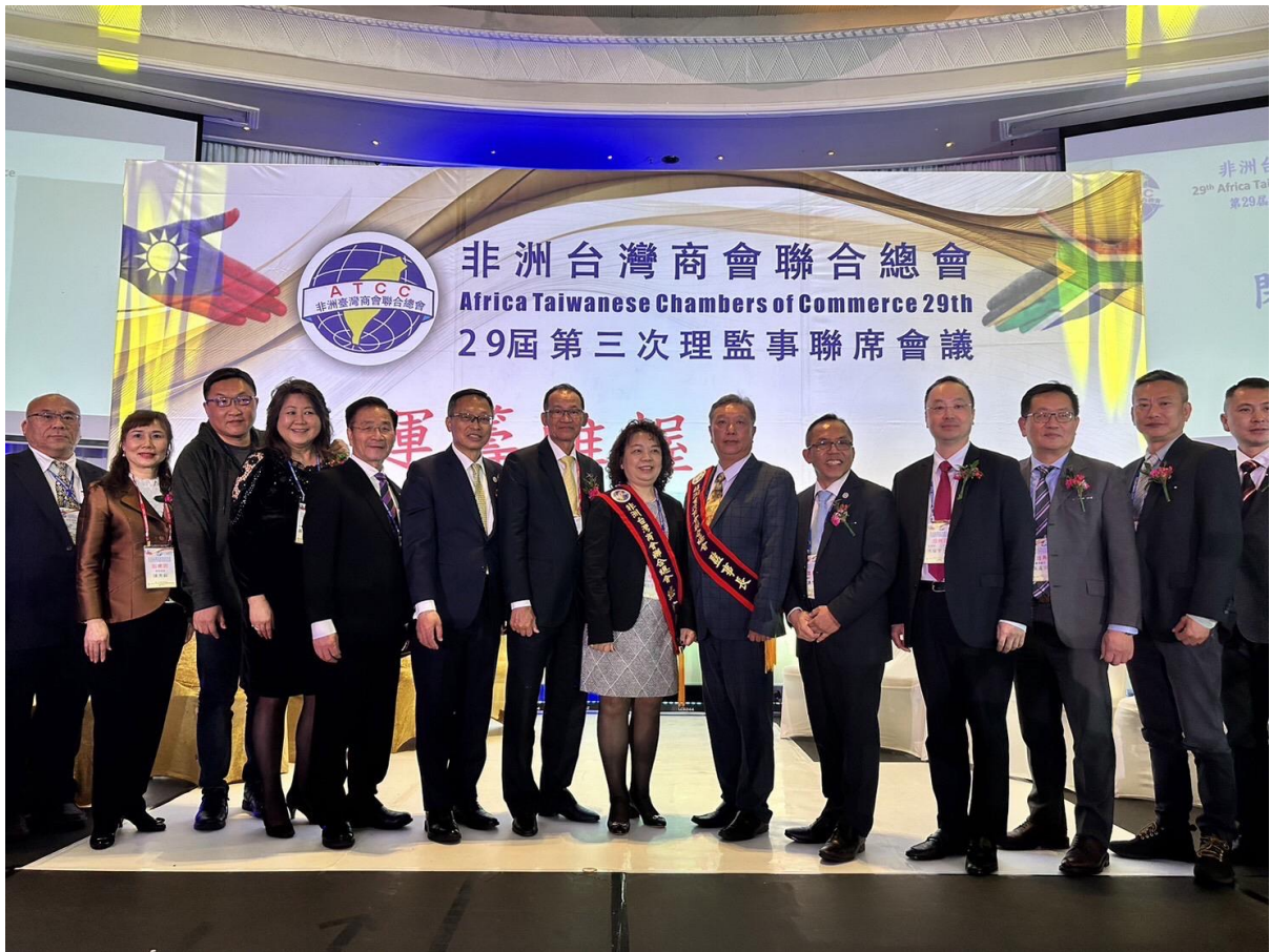
◎台上貴賓合影留念。