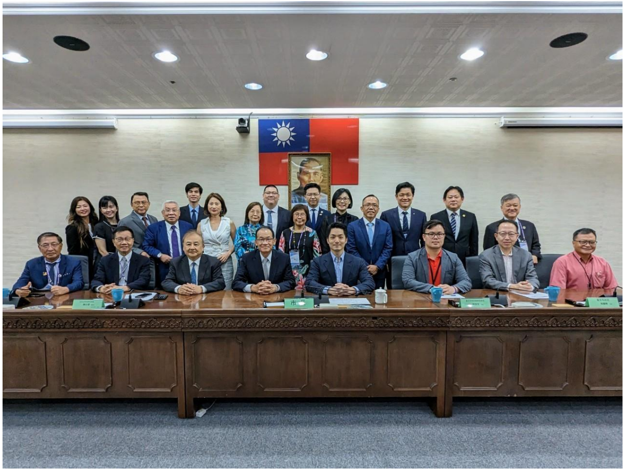
◎拜會台北市政府-訪問團與蔣市長萬安合影。