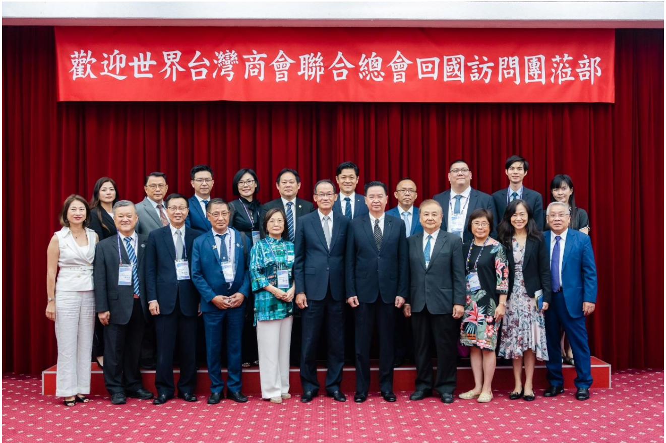
◎訪問團與外交部吳部長釗燮合影。