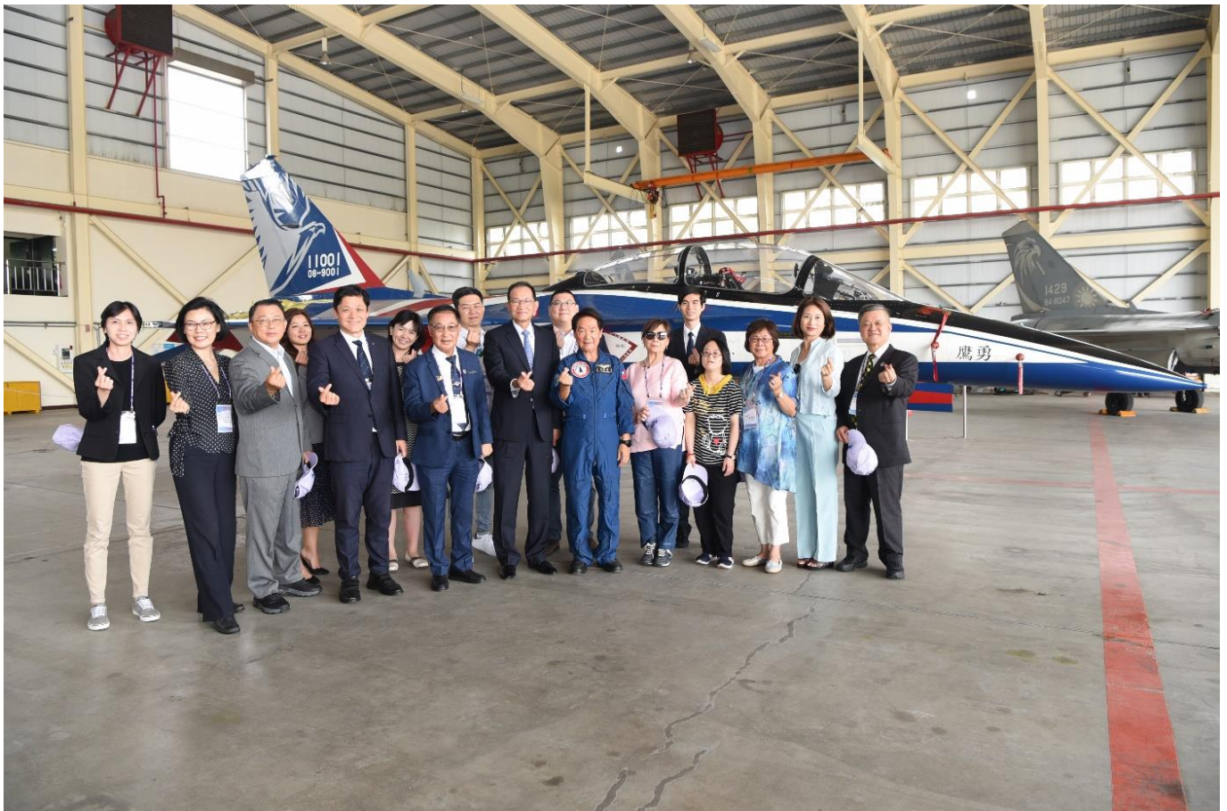
◎參觀新式高教機勇鷹號。