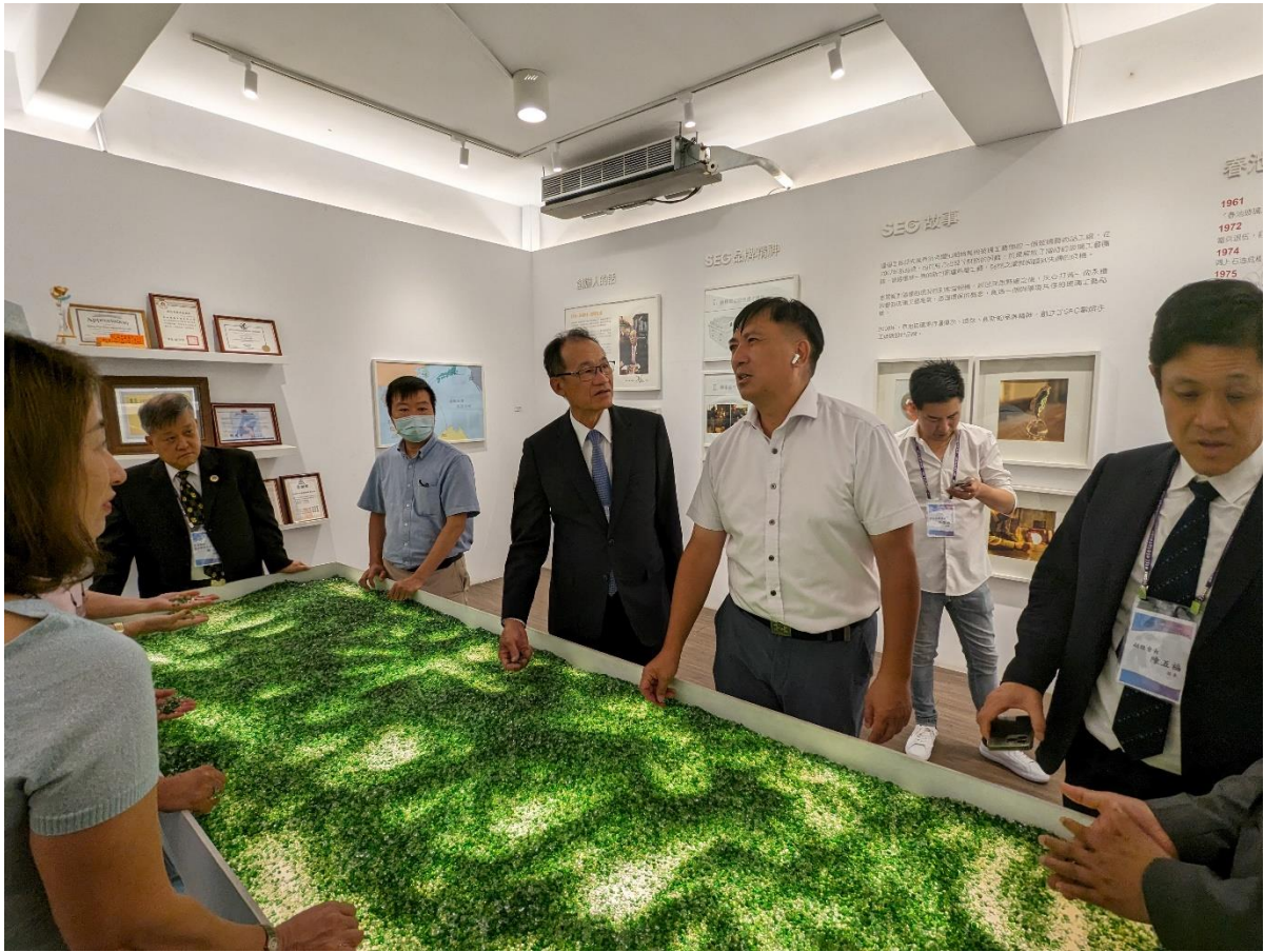
◎春池玻璃林建仲總經理介紹廢玻璃回收再製過程。