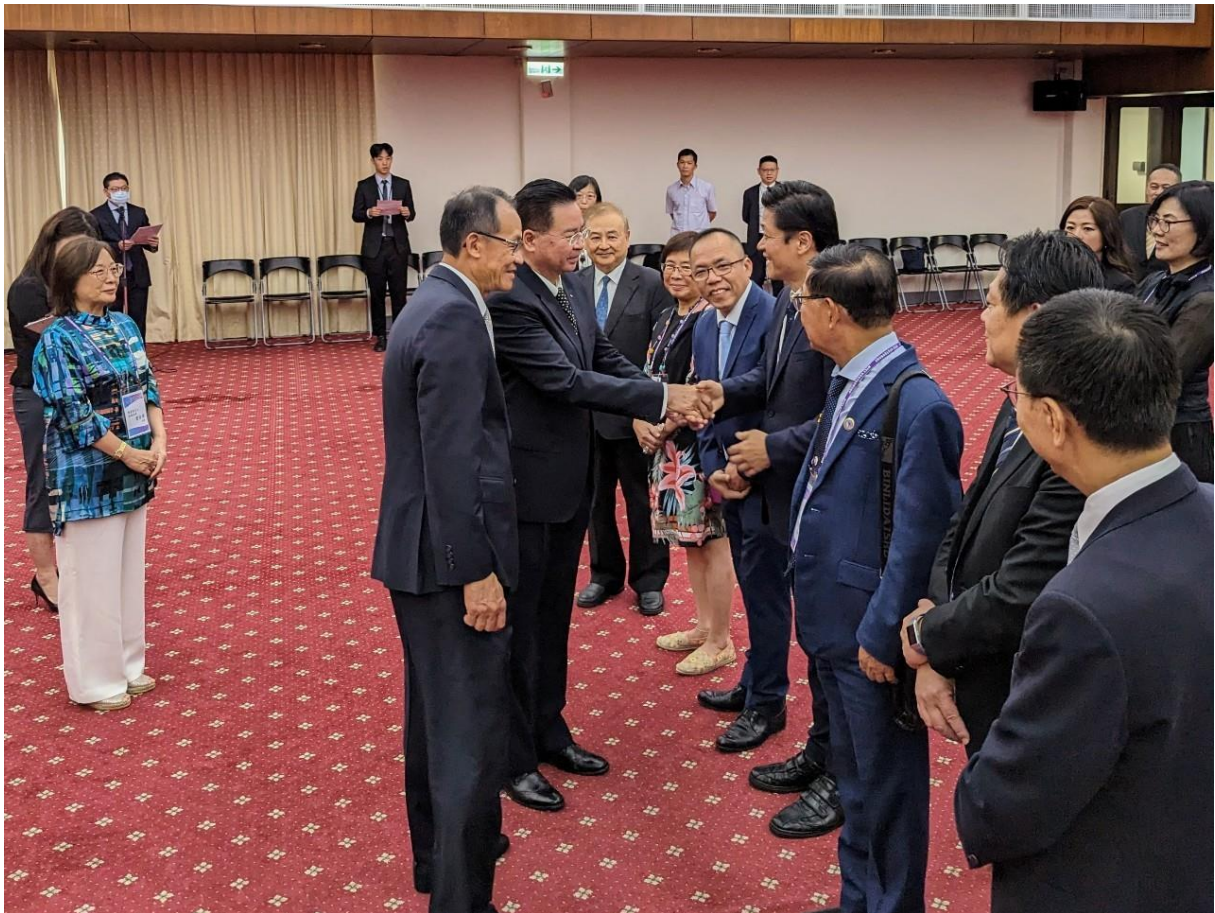
◎黃總會長行德介紹訪團成員。