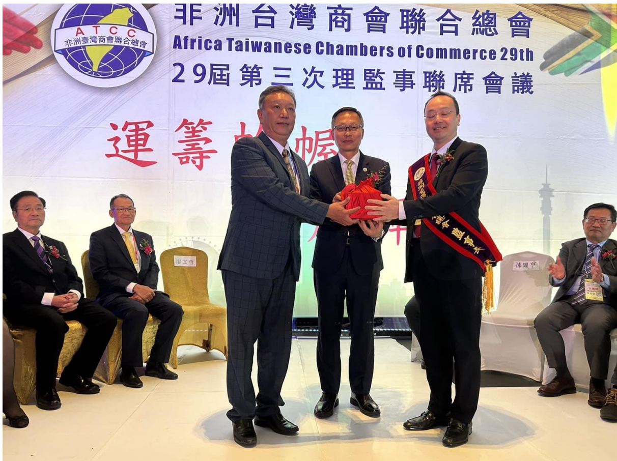
◎新舊任監事長交接，由駐南非代表廖文哲大使監交。