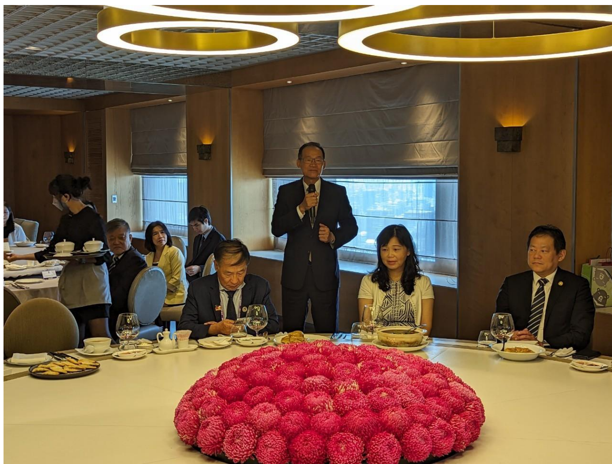
◎黃總會長行德感謝外貿協會長期對於本總會台商的支持與協助。