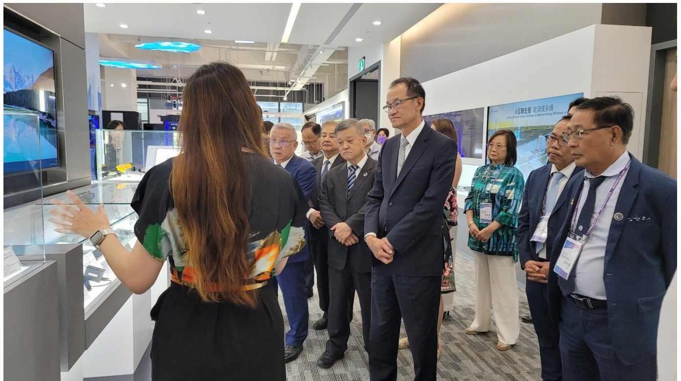
◎台達電子工業股份有限公司介紹業務發展狀況。