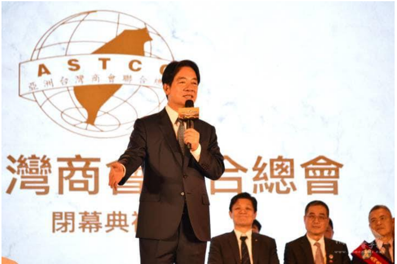
◎賴副總統清德於閉幕典禮致詞。