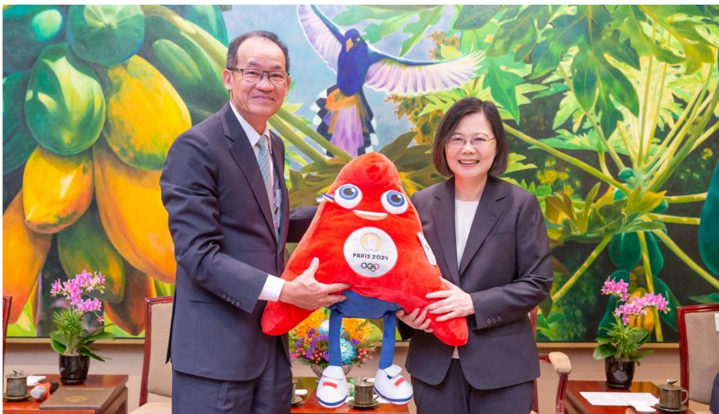
◎黃總會長行德贈予蔡總統英文象徵自由、包容的奧運吉祥物 Phryge。