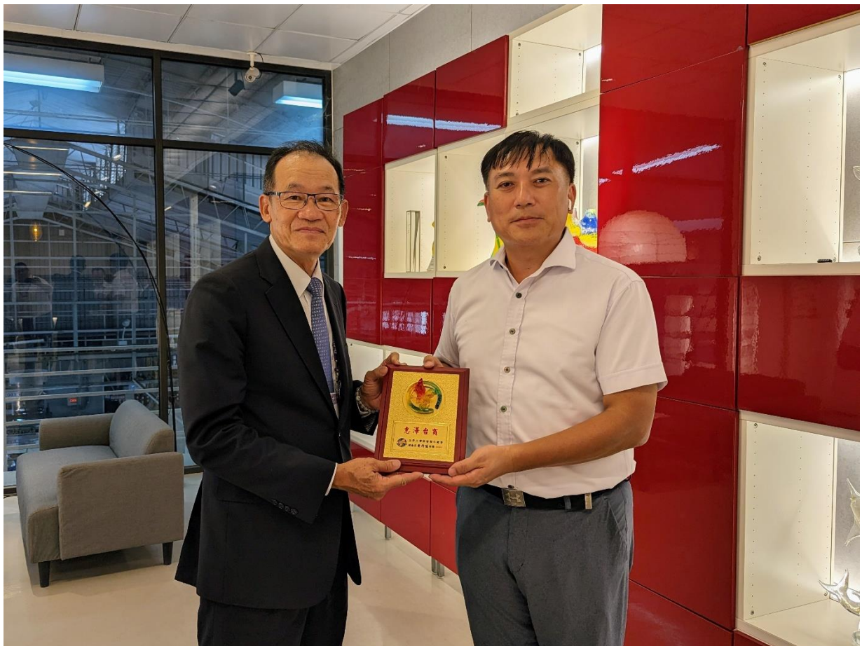
◎企業參訪-春池玻璃。