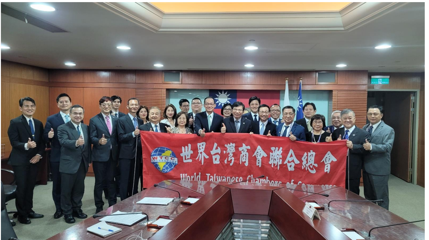
◎訪問團與交通部王部長國材合影。