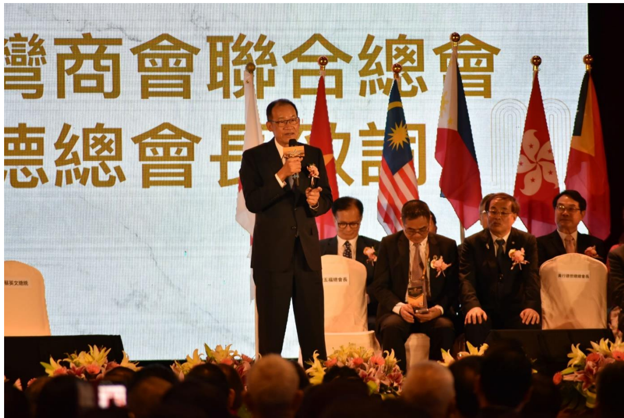
◎黃總會長行德於開幕典禮致詞。