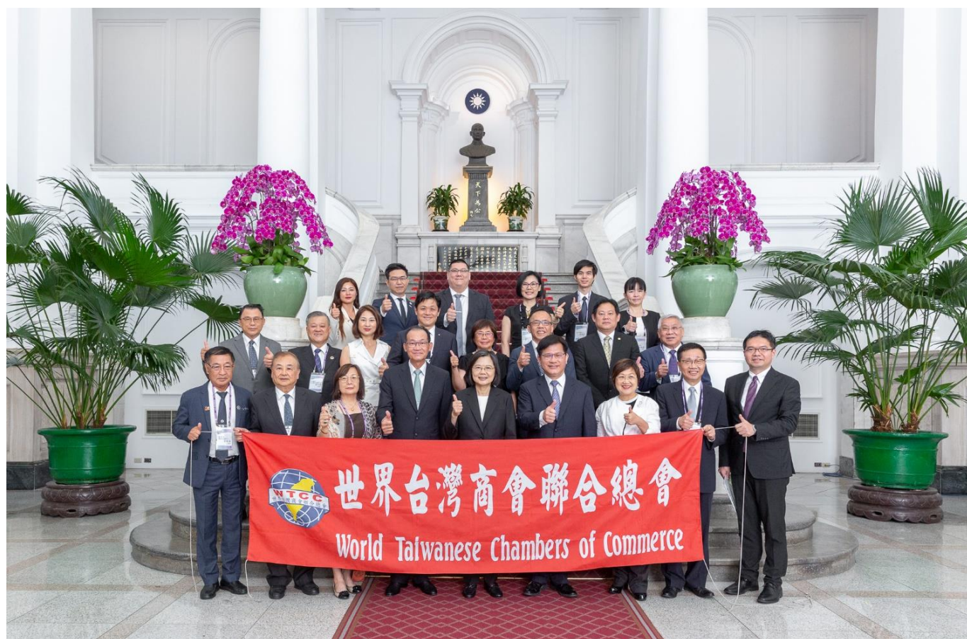
◎訪問團與蔡總統英文於總統府合影留念。