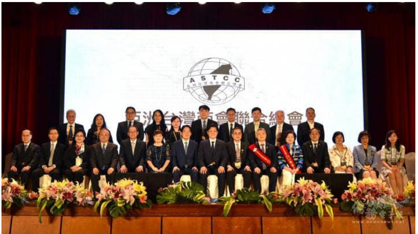
◎與會貴賓台上合影留念。