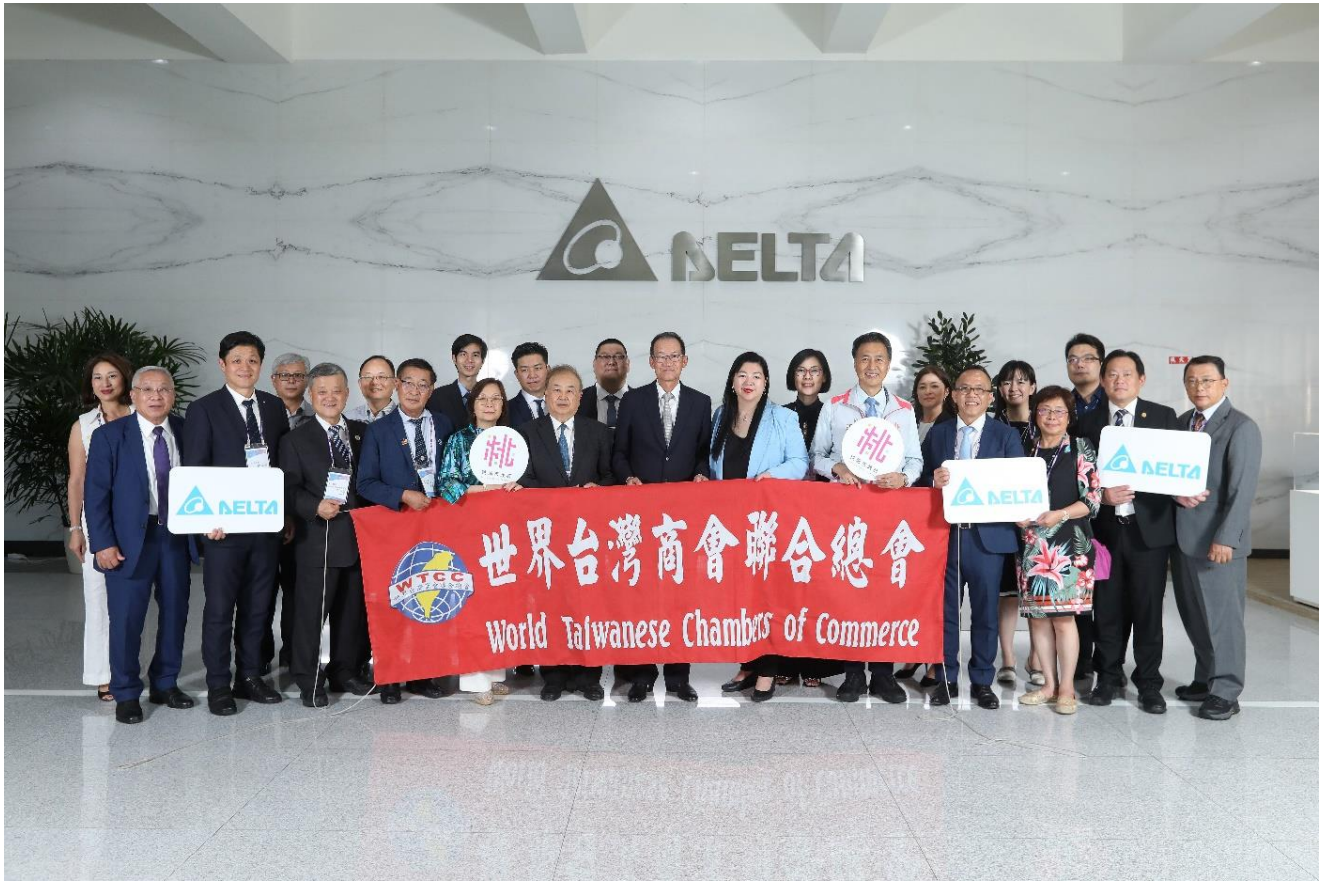
◎企業參訪-台達電子工業股份有限公司。