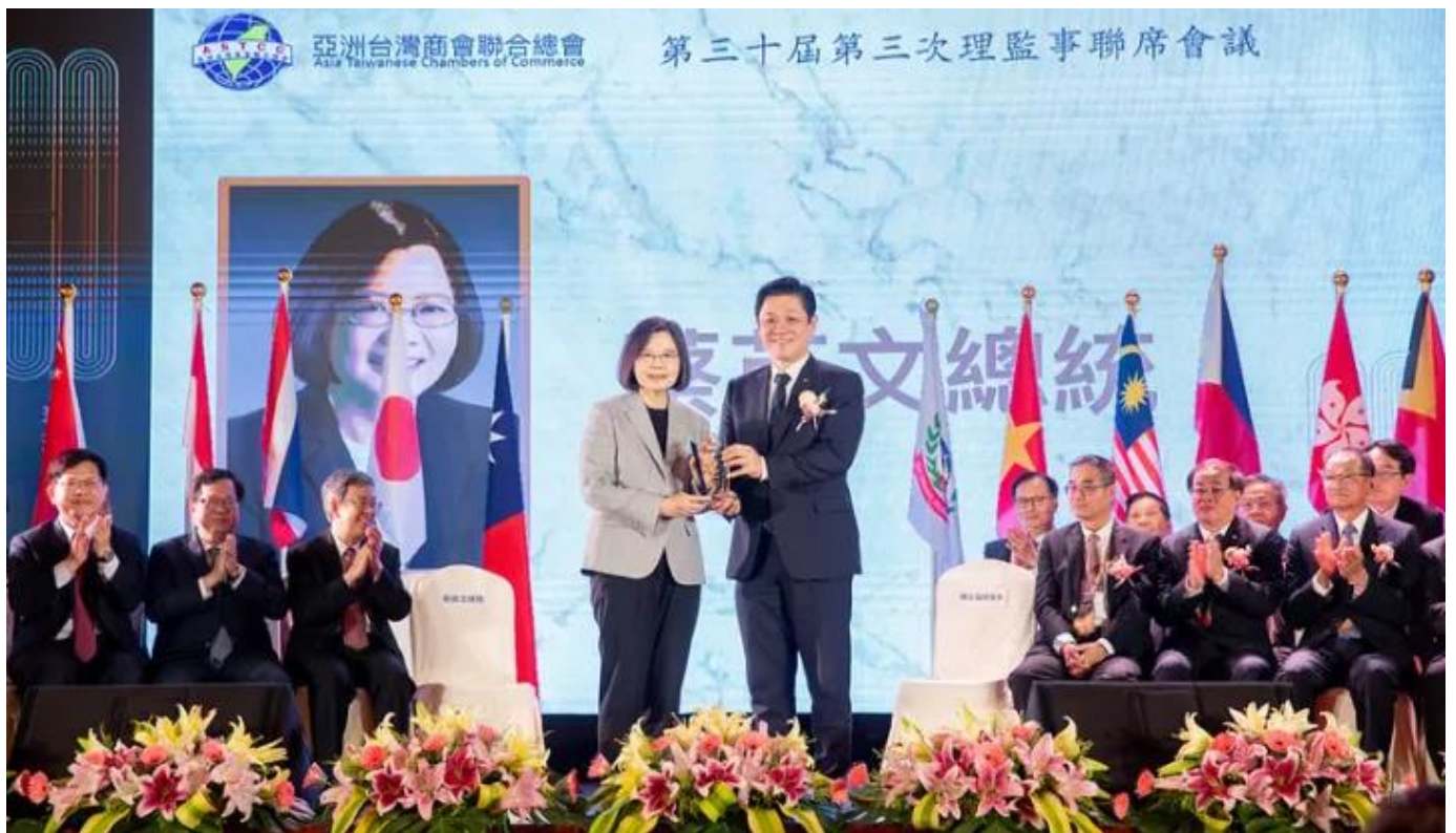
◎陳總會長五福致贈感謝牌給蔡總統英文。