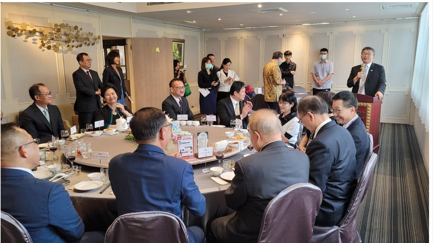
◎立法院世界台商之友會會長蔡副院長其昌致歡迎詞。