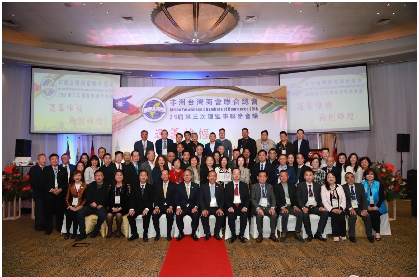
◎與會人員合影留念。