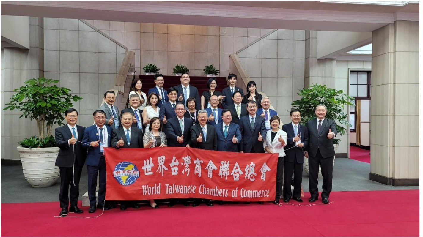
◎訪問團拜會行政院，並與陳院長建仁及鄭副院長文燦合影。