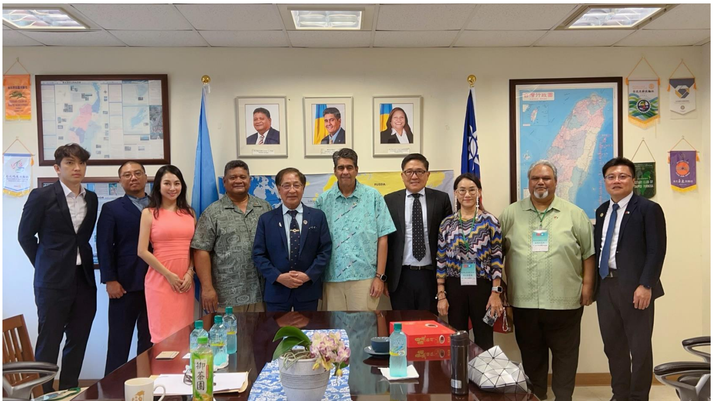
◎世總人員及帛琉總統及使館人員合影留念。