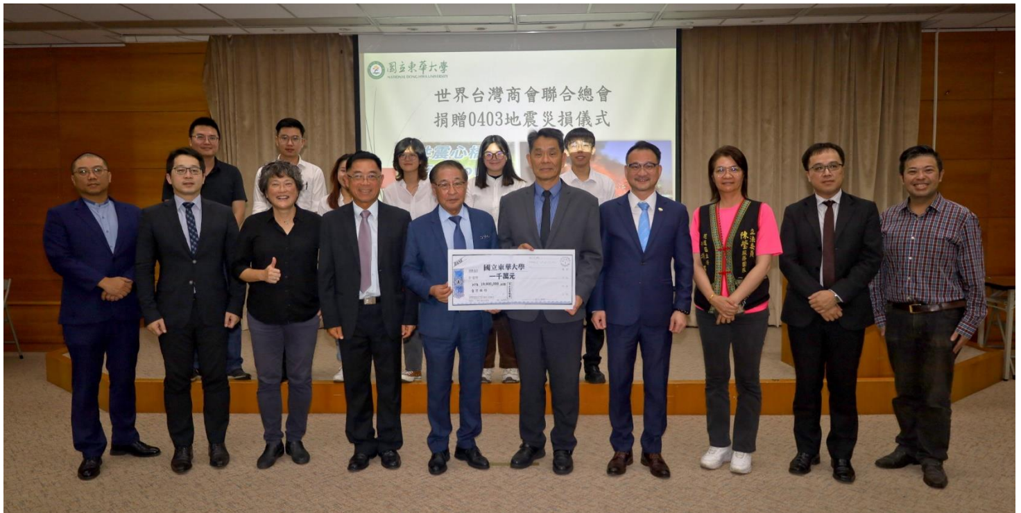
◎捐贈儀式與會人員合影。