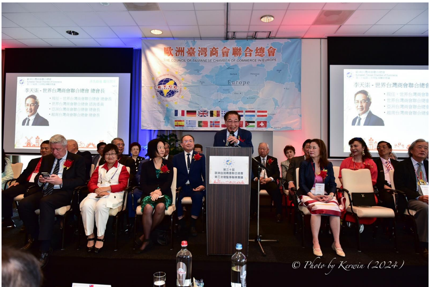
◎李總會長天柒於開幕典禮致詞。

歐洲台灣商會聯合總會於5月11日至13日假荷蘭NH Amsterdam Schiphol Airport舉辦第30屆會員代表大會暨第3次理監事聯席會議，現場齊聚近二百名來自歐洲各地的台商，本總會李總會長天柒、僑務委員會徐委員長佳青、監察院陳院長菊及當地政要亦受邀出席盛會。