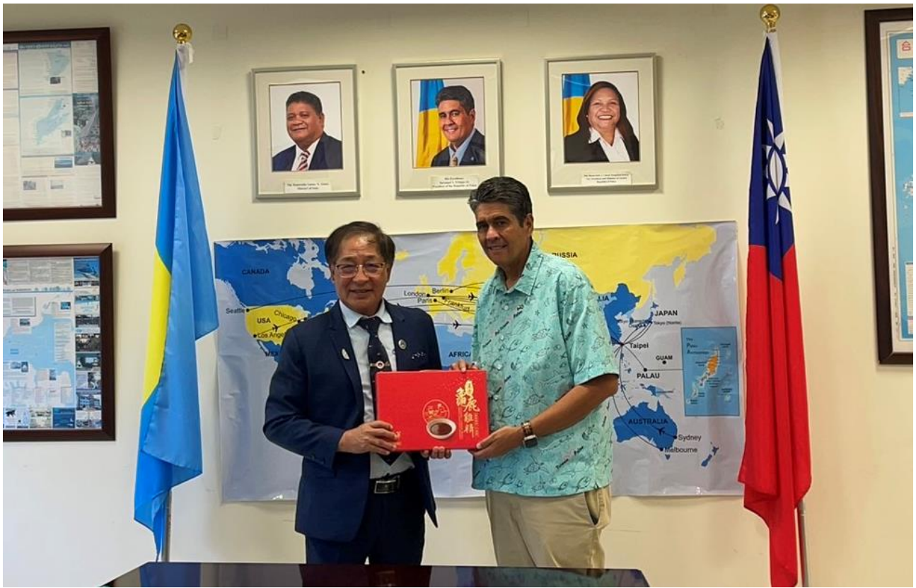
◎李總會長天柒回贈禮品予總統惠恕仁(Surangel Whipps Jr)。